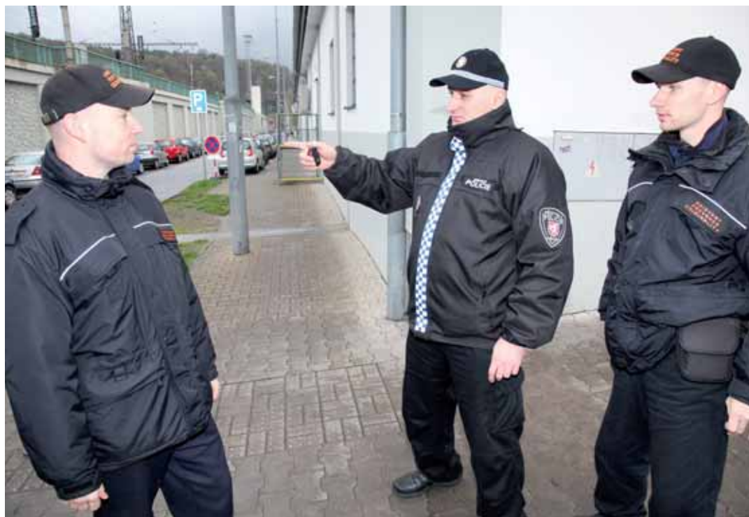
Asistenti prevence kriminality v Děčíně (ilustrační snímek z letošního dubna).