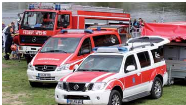
HZS Ústeckého kraje spolupracuje se svými německými kolegy.

Hasičský záchranný sbor má ve vinku i prevenci, preventivně výchovnou činnost, ochranu obyvatelstva, krizové řízení a z hlediska státní správy navenek