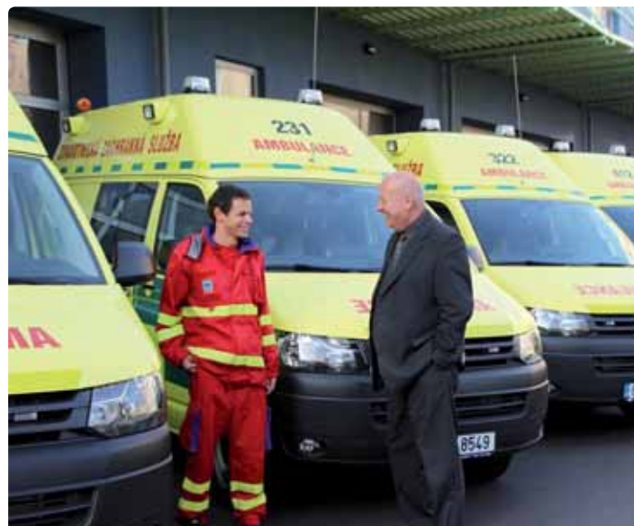
Hejtmán Ústeckého kraje Oldřich Bubeníček v diskuzi o nových vozích ZZS.