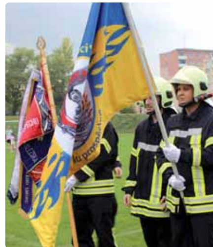
Slavnostní nástup pod zástavou jednotky dobrovolných hasičů v Klášterci nad Ohří.

Ke 140. výročí vzniku jednotky sboru dobrovolných hasičů v Klášterci nad Ohří přijel počátkem září poblahopřát hejtman Ústeckého kraje Oldřich Bubeníček. Při této příležitosti udělil jednotce hejtmanskou stuhu, kterou připevnil na zástavu kláštereckých hasičů.