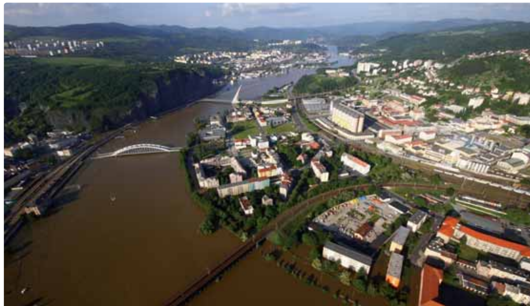
Zaplavené Ústí v době kulminace - 6. června 2013 byla výška hladiny 1072 cm a průtok činil 3700 m 3 za vteřinu.

Ať již jako povodně po dlouhých a vydatných deštích, které rozvodní toky od pramenů až k dolnímu Labi, nebo krátkodobé záplavy po krátkých, ale vydatných srážkách a průtržích mračen. Povodně zasáhly náš kraj opakovaně – v letech 2002, 2006, 2009, 2012 nebo i vloni, v roce 2013. Kromě toho, že ničily majetky a braly lidské životy, mají společně lidskou solidaritu, perfektní nasazení členů všech složek Integrovaného záchranného systému Ústeckého kraje a koordinaci odstraňování prvotních škod a posléze obnovu celého území postiženého povodněmi. Loňské povodně nás postihly počátkem června a byly opravdu na řadě míst kraje ničivé. I dnes, při čtení zpráv ze zasedání Povodňové komise a Bezpečnostní rady Ústeckého