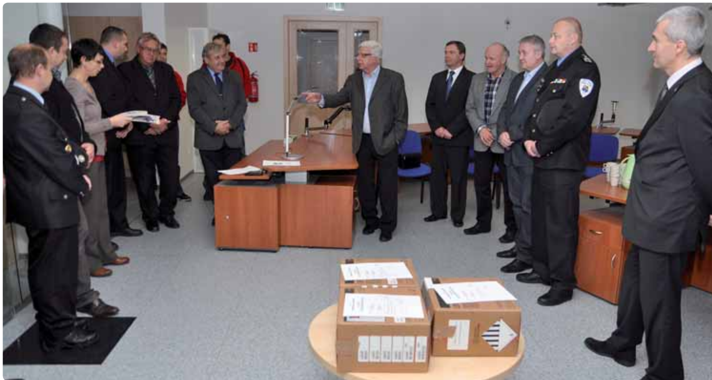
Milá jsou pravidelná setkání zástupců Ústeckého kraje a složek IZS u příležitosti předávání nových defibrilátorů. Náš snímek je z prosince loňského roku.

Defibrilátor vyhodnocuje srdeční činnost, diagnostikuje život ohrožující srdeční arytmií, asystolii a s využitím defibrilačních výbojů zachraňuje životy při náhlé srdeční zástavě. Defibrilátory jsou logicky potřebné okamžitě při nehodách třeba na silnicích nebo u průmyslových havárií. Proto je nemají výhradně zdravotničtí záchranáři nebo osádky sanitek, ale také dopravní policisté nebo profesionální hasiči.