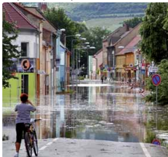
Zaplavené centrum města Lovosice. Voda z Labe sem měla opravdu dlouhou cestu, v „normální“ době je odsud řečiště několik set metrů.