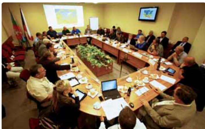
Krizový štáb zasedal na Krajském úřadu Ústeckého kraje v době povodní v podstatě denně.

ukázkami děsů a řádění. Podívejme se alespoň několika čísly a fotografiemi na povodně v červnu roku 2013.