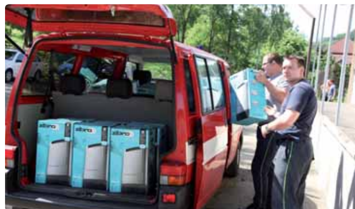
Centrum humanitární pomoci v České Kamenici: Pár dní po nástupu povodní se už do jednotlivých měst postižených velkou vodou rozvázela potřebná zařízení – například vysoušeče pro Hřensko.