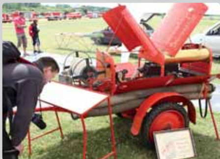
V Dobroměřicích byla předmětem obdivu stále fungující místní pýcha - dvoukolová motorová stříkačka MO 2 z roku 1933 vyrobená firmou R. A. Smekala ze Slatiňan.

lých kolektivů, dobroměřického. Na červnové oslavě byl citován dopis starosty Loun s díky za pomoc při odstraňování následků loňské povodně v tomto okresním městě. Samozřejmě že na oslavě 120 let byli i kolegové odjinud, společně tu tleskali oceňovaným, s dojetím vyslechli píseň o svatém Floriánovi, patronovi hasičů, a obdivovali starou techniku i ukázky náročné práce složek IZS.