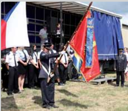
Jsmo na oslavě dobroměřického sboru. Byl červen 2014 a slavili tu 120 let od vzniku.