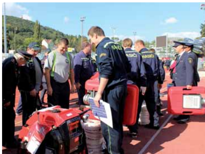
Předání darů na soutěži Tohatsu.