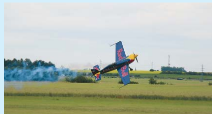
TUHLA KREV všem návštěvníkům, kteří se dívali na akrobatickou show Martina Šonky. Jeho letoun byl postaven speciálně pro závody Red Bull Air Race.