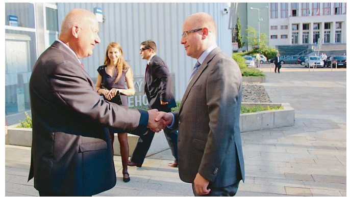
ČESTNÝ HOST Předsedu vlády ČR Bohuslava Sobotku uvítal na Krajském úřadě Ústeckého kraje hejtmán Oldřich Bubeniček.

Primo v prostředí Krušných hor se pak premiér zajímal