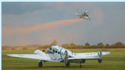
VRTULNÍK V AKCI. Na memoriálu se představilo na několik desítek letadel i vrtulníků.