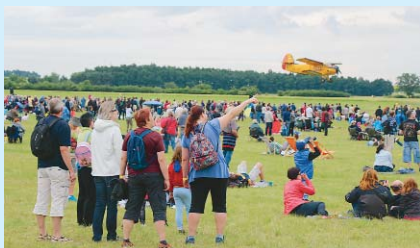
BÁJEČNÁ PODIVANA se naskytla návštěvníkům při Memorial air show 2015 na letišti v Roudnici nad Labem.