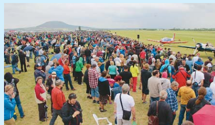
REKORDNÍ NÁVŠTĚVA. Na roudnickém letišti se za dva dny vystřídalo přes 50 tisíc lidí. Generálním partnerem akce byl Ústecký kraj.