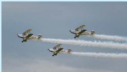
VZDUŠNÁ SYNCHRONIZACE. Dvojlošňky byly ve vzduchu sehrané.