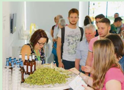
ZATEKÉ PIVO šlo hlavně u mladých lidí na dračku.