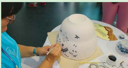
K VIDĚNÍ BYLO i zdobení tradičního českého cibuláku.