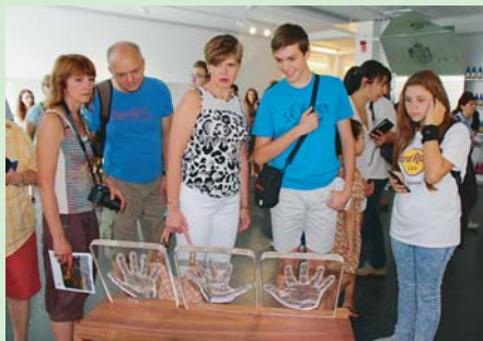
NAVŠTĚVNÍCI obdivovali křišťálové otisky dlaní světových osobností z terezínského muzea.