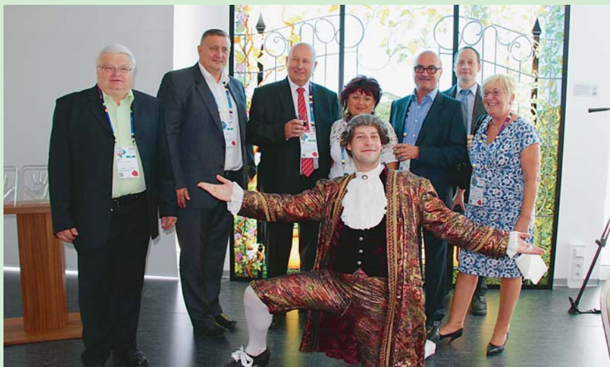
GIACOMO CASANOVA přivítal také hejtmana Ústeckého kraje s jeho radními.