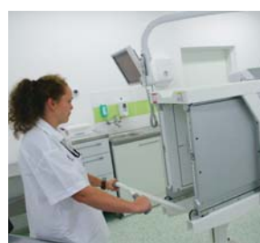
INTERIÉRY zdobí moderní stínící kobka.

Stavební úpravy prvního nadzemního podlaží (přízemí) onkologického oddělení si vyžádaly investici v hodnotě 8,4 milionu korun a zahrnovaly přemístění ambulanci, úpravy vstupu, vestibulu, sociálních zařízení, čekáren a další dispoziční úpravy, které přispějí k celkové kultivaci daného pracoviště, a to ve prospěch pacientů a jejich blízkých i zaměstnanců.