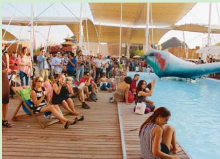
KAZDÝ DEN byl český pavilon velmi slušně zaplněn.