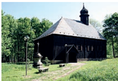
Autor: R. Sedláček

Kostel v příhraniční obci Český Jiřetín je jediným kompletně dřevěným kostelem v Krušných horách. Kostelík byl postaven ve druhé polovině 17. století v obci Fláje, kde stál až do roku 1969. Při stavbě přehrady Fláje byl kostelík jako jediná stavba zatápěné obce zachráněn a přestěhován do nedalekého Českého Jiřetína. Zajímavostí je, že do zvonice byl v roce 1999 nainstalován zvon, který původně visel v kostele v obci Klín. Dnes si v kostelíku můžete prohlédnout výstavu o historii příhraničních obcí nebo navštívit koncert dětských pěveckých sborů, který se zde koná v předvánoční době.