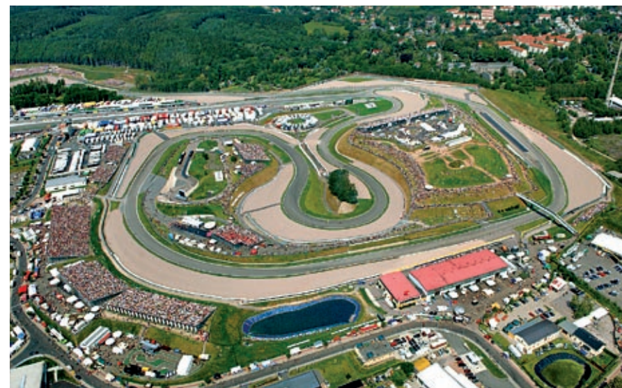
Sachsenring z ptáčích perspektiv

Závody motorek GP na Sachsenringu – Hohenstein-Ernstthal – www.sachsenringgp.de