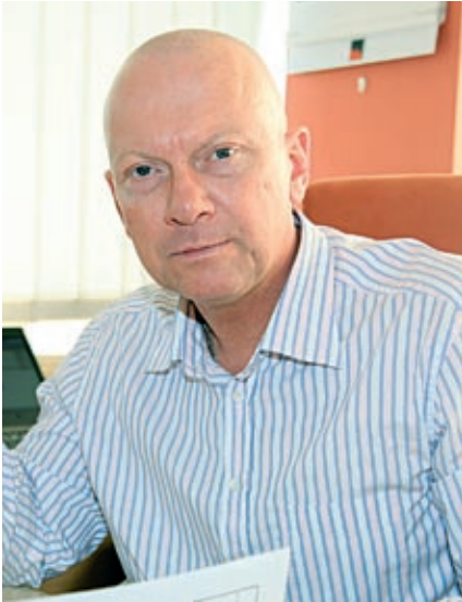
Ing. Pavel Kouda, náměstek hejtmanky Ústeckého kraje