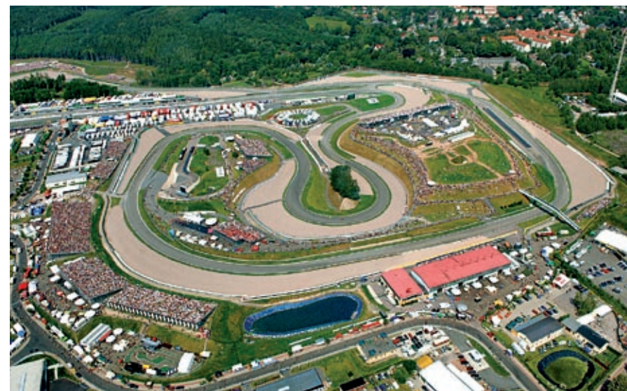
Sachsenring aus der Luft

Motorrad Grand Prix auf dem Sachsenring – Hohenstein-Ernstthal – www.sachsenringgp.de