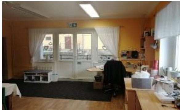
Kuchyň pro klienty