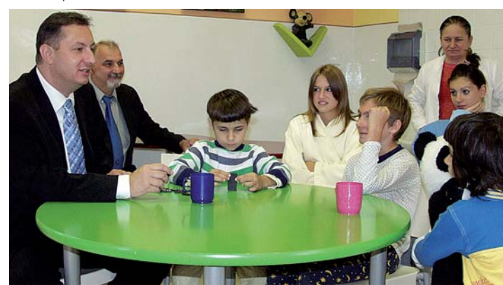
Školáky, kteří byli s začátkem školního roku hospitalizováni v teplické nemocnici, navštívil Petr Fiala

rodní den dětí, sem chodí pravidelně a vždycky malým pacientům přinese dárky. Tentokrát je rozdělil mezi devět dětí, které zahájení školního roku 2007/2008 zastihlo v nemocnici.