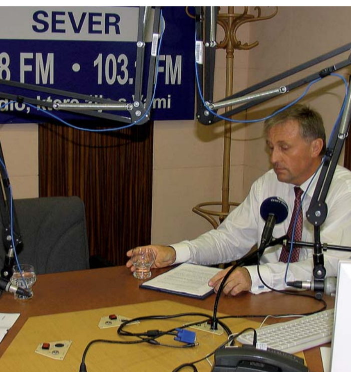
Předseda vlády byl také hostem Českého rozhlasu Sever v Ústí nad Labem. Odpovídal nejen na dotazy projednávané daňové reformy, ale nezaváhal ani v odpovědích, v nichž se vyznal z vřelého vztahu k našemu kraji.

Návštěva premiéra Mirka Topolánka je zaznamenána nejen ve fotografiích, ale i v Pamětní knize Ústeckého kraje