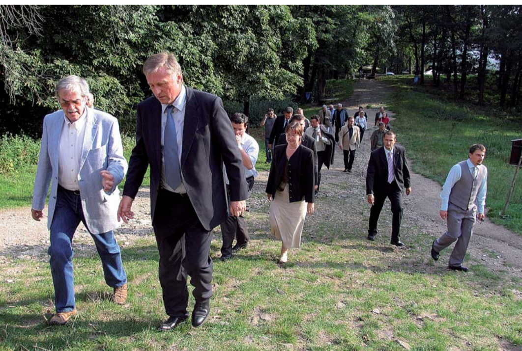
Náš kraj se pyšní stovkami unikátních přírodních scenérií. Na horu Říp se vydal premiér Topolánek i se svým doprovodem.