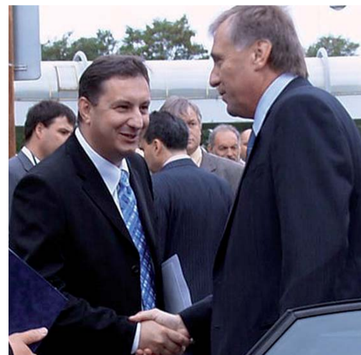
Několik hodin své pracovní cesty věnoval premiér návštěvě areálu Masarykovy nemocnice v Ústí nad Labem. Při příjezdu ho přivítal také náměstek hejtmána Petr Fiala.