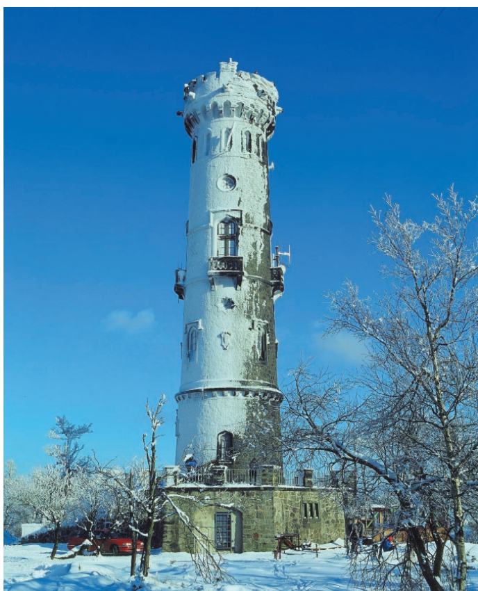
Rozhledna na Děčínském Sněžníku je vyhledávaným turistickým cílem i v zimních měsících.

Mezi unikátní přírodní lokality, které můžeme najít v Ústeckém kraji, bezesporu patří Děčínský Sněžník (723 m n. m.). Tato stolová hora je nejvyšším bodem Děčínské vrchoviny a