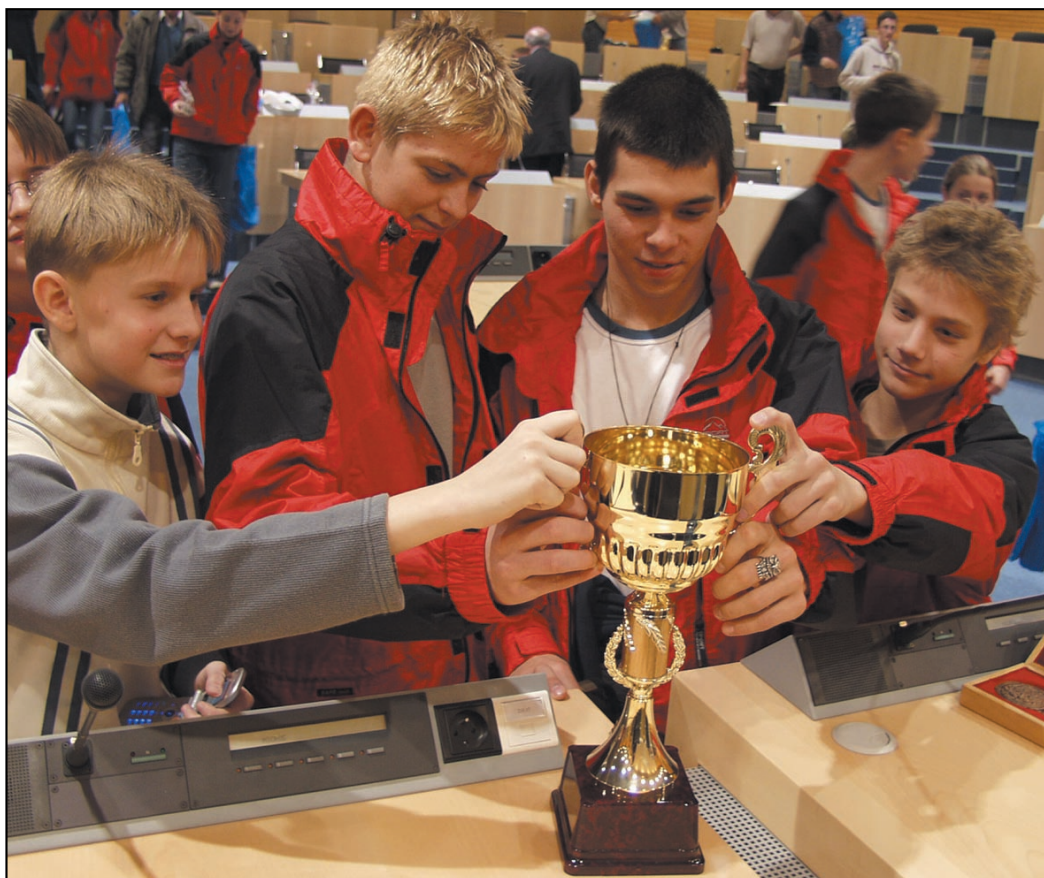
Pohár za druhé místo je pro reprezentanty Ústeckého kraje vynikajícím úspěchem.