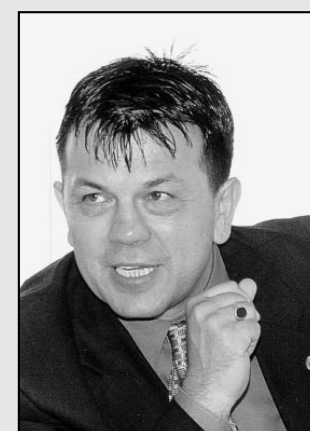
Jaroslav Foldyna 1. náměstek hejtmána Ústeckého kraje

a u ostatní obslužnosti obce. Pro rok 2004 jsme navrhli obcím hrazení těchto ztrát tak, aby samosprávy zaplatily za každého svého obyvatele 150 korun ročně. Přibližně sedmdesát procent obcí ale v polemicke tento způsob společného hrazení ztrát zcela legitimně odmítlo. V rámci jakési pseudodiskuse, kterou jsem sledoval v tisku, jsem si bohužel přečetl i řadu nepravdivých tvrzení. Například nám bylo podsouváno, že obcím tyto příspěvky nařizujeme. Rád bych představitele obcí, kterým se navržený princip solidarity s ostatními nelíbí, upozornil na několik podstatných skutečností. Předně – krajským úřadem navrhovaná dopravní obslužnost víceméně kopíruje