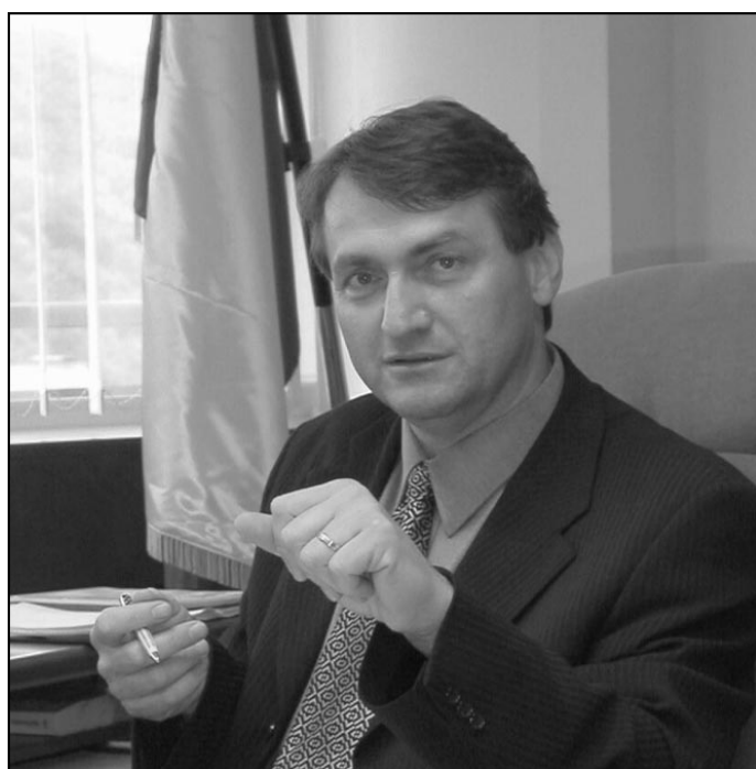
Jiří Šulc, hejtman Ústeckého kraje.

Na základě doporučení zdravotní a sociální komise se dále Rada Ústeckého kraje rozhodla o víkendech a v nepracovních dnech obnovit provoz dvou ordinací zajišťujících stomatologickou pohotovost, a to za předpokladu, že v této věci budou praktičtí lékaři - stomatologové s krajem účinně spolupracovat. „Vracíme se k tomuto systému, protože pacienti ještě neumí pečovat o svůj chrup tak, aby omezili nebo zcela vyloučili nutnost vyhledávat pohotovost. Musíme se smířit s tím, že vychovat pacienty