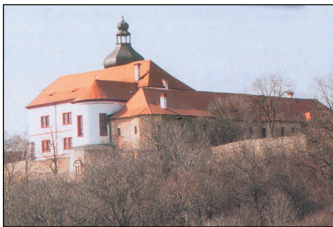
Zámek Nový Hrad u Jimlína