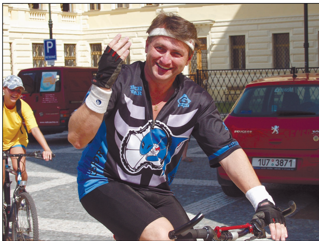
Hejtmán Ústeckého kraje Jiří Šulc.