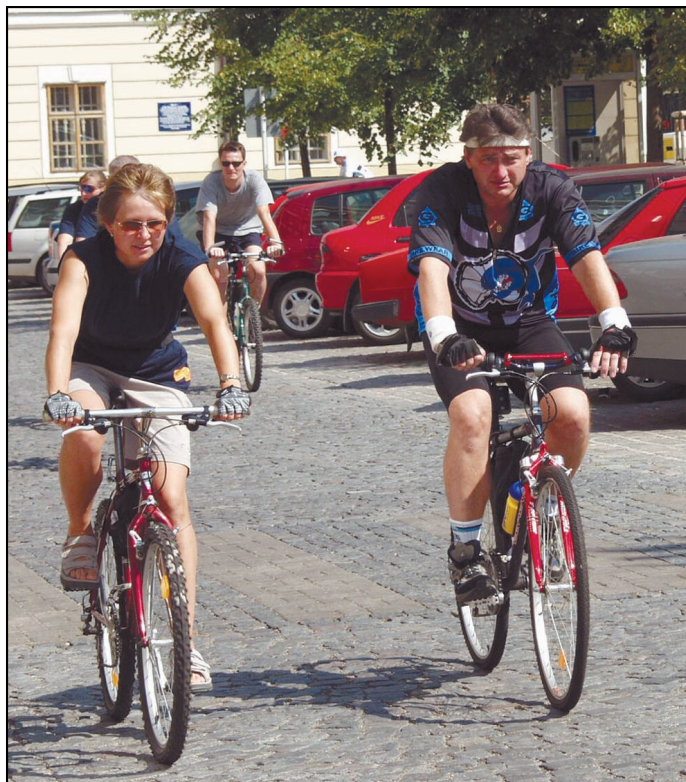
Hejtmán Ústeckého kraje Jiří Šulc urazil v rámci štafetové jízdy Krásná země pětadvacetikilometrovou trasu z Loun přes Postoloprty do Žatce.

Střekov a prodlužuje ji do Svádova. Cyklostezka by měla v budoucnu být součástí trans-evropské cyklistické magistrály, která povede z Hamburku přes Drážďany, Děčín, Ústí nad Labem a Litoměřice až do Prahy. „Ústecký kraj má na rozvoji cykloturistiky zájem a počítá s ním i ve svých rozvojových programech. Byl bych rád, kdyby se v budoucnu podařilo jednotlivé cyklostezky spojit v ucelenou síť,” dodal Pavel Tošovský.