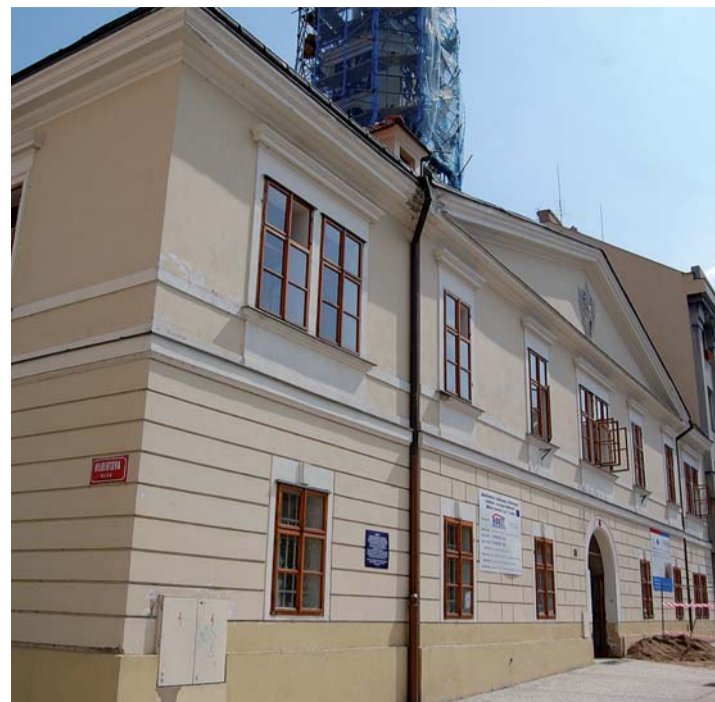
Projekt Informační a vzdělávací centrum – Městská knihovna v Lounech. Příjemce dotace: Město Louny, datum zahájení a ukončení realizace projektu: 1.1. 2009 – 1.3. 2011, celkové náklady: 54,347 mil. Kč, dotace z ROP: 50,271 mil. korun.

Možnost získat podporu z Regionálního operačního programu Severozápad je pro žadatele z řad obcí, měst, neziskových organizací i podnikatelů stále otevřená. Připravují se další výzvy, v rámci kterých bude možné podávat do ROP Severozápad žádosti o dotace. Bližší informace o těchto výzvách i podrobné podmínky pro poskytnutí dotace najdete na www.nuts2severozapad.cz