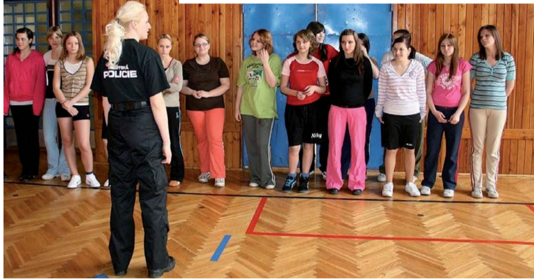
Dva snímky ukazují některé z projektů financovaných v rámci prevence kriminality