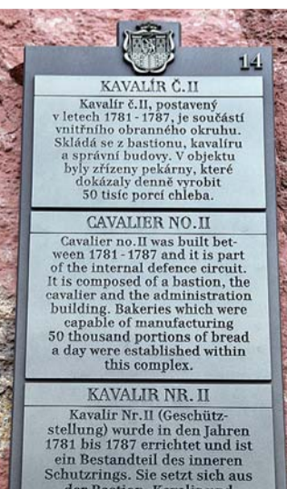
KAVALÍR Č. II Kavalír č. II, postavený v letech 1781–1787, je součástí vnitřního obranného okruhu. Skládá se z bastionu, kavalíru a správní budovy. V objektu byly zřízeny pekárny, které dokázaly denně vyrobit 50 tisíc porcí chleba. CAVALIER NO. II Cavalier no. II was built between 1781–1787 and it is part of the internal defence circuit. It is composed of a bastion, the cavalier and the administration building. Bakeries which were capable of manufacturing 50 thousand portions of bread a day were established within this complex. KAVALÍR NR. II Kavalír Nr. II (Geschützstellung) wurde in den Jahren 1781 bis 1787 errichtet und ist ein Bestandteil des inneren Schutzrings. Sie setzt sich aus

Projekt bude financován částkou bezmála půl miliardy korun z evropských peněz, z Integrovaného operačního programu Ministerstva kultury ČR, plánovaný termín dokončení čtyř objektů z „první vlny“ projektu oživení pevnosti je rok 2013.