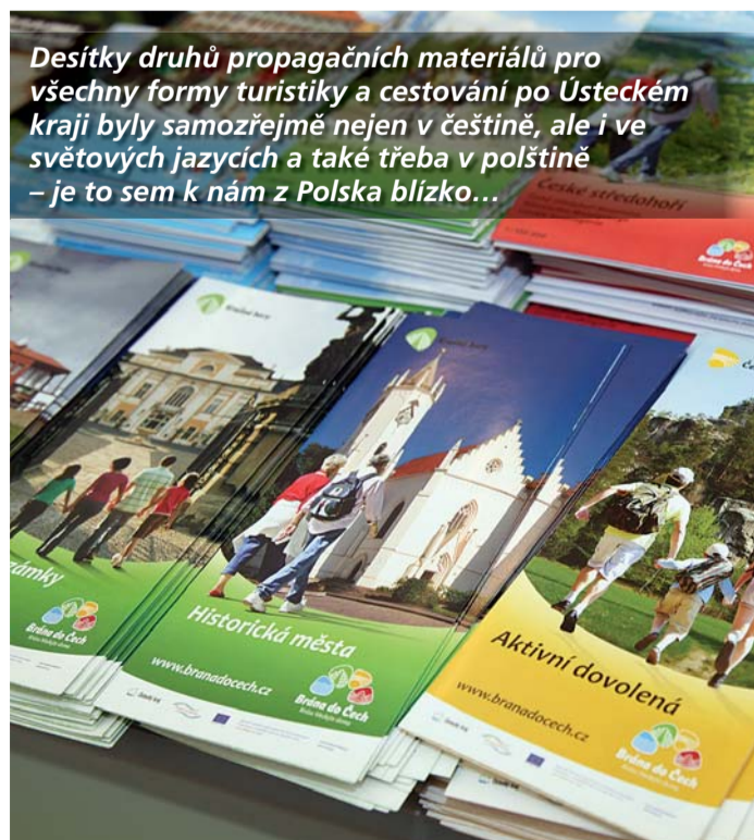
Desítky druhů propagačních materiálů pro všechny formy turistiky a cestování po Ústeckém kraji byly samozřejmě nejen v češtině, ale i ve světových jazycích a také třeba v polštině – je to sem k nám z Polska blízko...