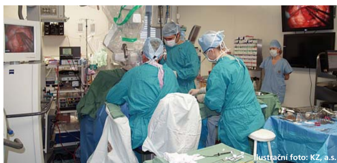
ilustrační foto: KZ, a.s.

členové krajské rady, svolána byla rovněž Bezpečnostní rada Ústeckého kraje, na níž hejtmanka konstatovala, že „přes