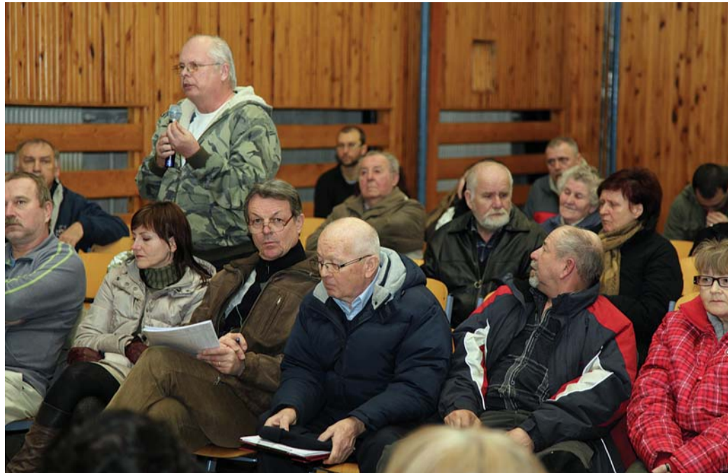
O další setkání kvůli dostavbě dálnice přes České středohoří byl ve Velemíně mezi občany velký zájem