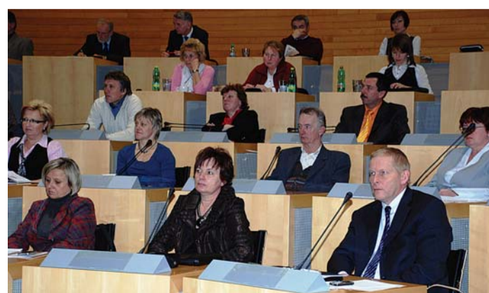
Náš snímek byl pořízen v konferenčním sále krajského úřadu ve čtvrtek 10. února