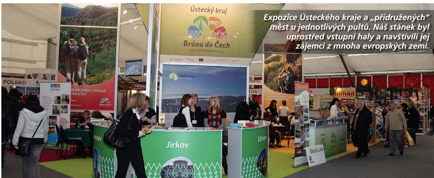
Expozice Ústeckého kraje a „přidružených“ měst u jednotlivých pultů. Náš stánek byl uprostřed vstupní haly a navštívili jej zájemci z mnoha evropských zemí.

i obsahově promyšleným projektem ÚK – Brána do Čech, jehož podtitul zní Krásu hledejte doma! Veřejnosti tu byly k dispozici zajímavé brožury o čtyřech turistických destinacích na území kraje (Dolní Poohří, České středohoří, České Švýcarsko a Krušné hory), zájem byl rovněž o propagační materiály, mapy a letáky o hradech a zámcích kraje, o trávení aktivní dovolené, o historických a královských městech, přírodních zajímavostech nebo o rozhlednách a vyhlídkách. To vše je samozřejmě také na webových stránkách kraje a speciálně také zmíněného projektu.