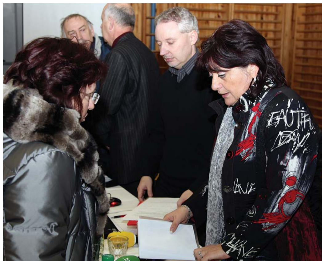
Hejtmanka při diskusi se zástupkyní Ministerstva životního prostředí České republiky