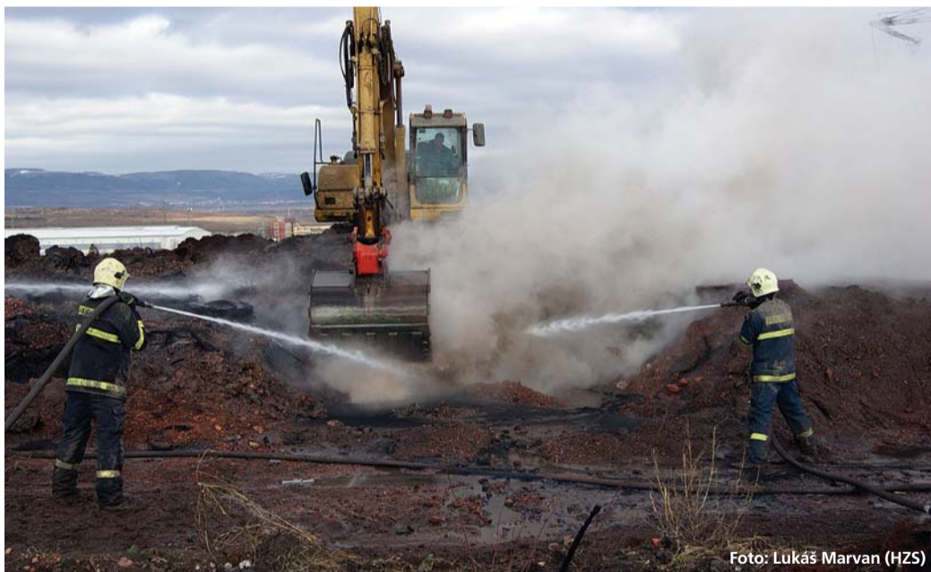
Profesionální hasiči z HZS Ústeckého kraje při konečné likvidaci požáru pneumatik v Tušimicích

Tušimice - Hasičskému záchrannému sboru Ústeckého kraje a dalším jednotkám se ve čtvrtek 11. února podařilo definitivně zlikvidovat dlouhotrvající požár pneumatik v areálu společnosti GRG Investment v Tušimicích na Chomutovsku. Zásah ke zdoání dýmajících a postupně vyhořívajících pneumatik inicioval Ústecký kraj, aby ochránil zdraví obyvatel v okolí. Firma GRG se k tomu neměla. Více než pět dní na skládce zasahovalo pět profesionálních jednotek z Chomutova, Klášterce nad Ohří, Žatce, Teplice a Ústí nad Labem a sedm dobrovolných (Maštov, Kovářská, Kadaň, Radonice, Klášterec nad Ohří, Černovice, Málkov). Na místě bylo celkem 12 cisternových automobilních stříkaček, vodu k hašení poskytla Elektrárna Tušimice. Náklady pouze na tento zásah se předběžně odhadují