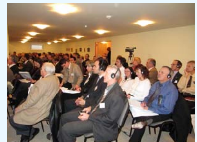
Konference přilákala mnoho odborníků z Maďarska, Německa, České republiky a Rakouska.

Konference byla zakončena exkurzí k poldrům na Tise dokončeným počátkem roku 2010.