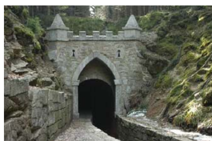
Ústí plavebního kanálu

Další informace: http://www.label-eu.eu/events/workshop-on-water-tourism.html