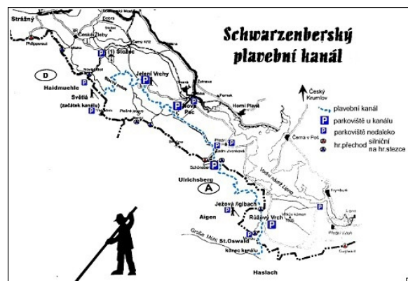
Mapka Schwarzenberského plavebního kanálu v příhraniční oblasti mezi Rakouskem a Českou republikou

Odpovědný partner: Lebensministerium Österreich (rakouské ministerstvo životního prostředí), RAK