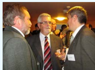
Důraz byl kladen na vzájemnou výměnu zkušeností.

Během prvního dne se v popředí zájmu nacházel management povodňových rizik a realizace směrnice EU o managementu povodňových rizik. Kromě průběžných výsledků z pracovní skupiny LABEL RISK byla prostřednictvím příspěvků z různých odborných oblastí představena maďarská opatření. Zástupci jednotlivých států, zemí a regionů navzdory částečně odlišným problémům identifikovali a prodiskutovali mnoho společných nápadů a myšlenek.