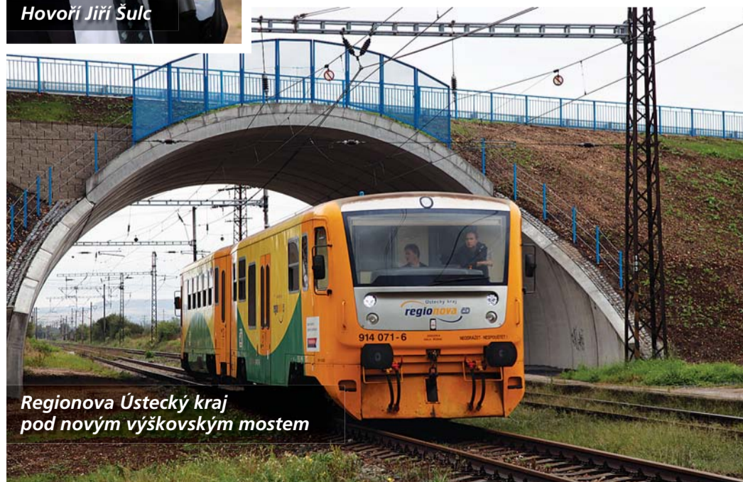
Regionova Ústecký kraj pod novým výškovským mostem

železobetonu, má klenbovou konstrukci a následně bylo těleso komunikace dosypáno zeminou. Most je prakticky bezúdržbový a jeho součástí jsou i nové chodníky pro pěší, osvětlení a vede jím nový vodovod pro zmíněnou obec. Most slavnostně uvedl do provozu ve čtvrtek 8. září Jiří Šulc, radní Ústeckého kraje pro dopravu a silniční hospodářství a poslanec Parlamentu ČR spolu s dalšími hosty.