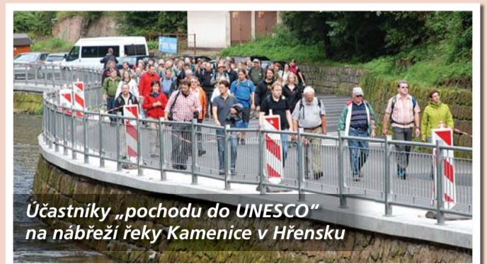
Účastníci „pochodu do UNESCO“ na nábřeží řeky Kamenice v Hřensku