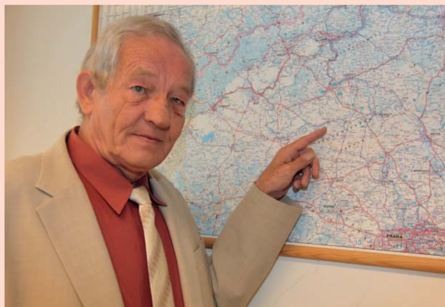
Tady jsou ty Libochovice, zajďte se tam podívat!

sledování. A letošní rok bude opět trochu výjimečný. Začala olympiáda a příležitost fandit našim sportovcům. Učiním tak i já. Přeji jim co největší úspěch.