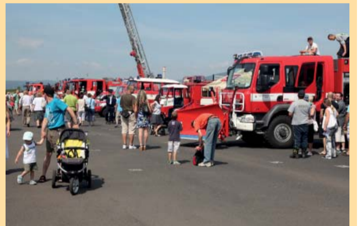
Na Dnu záchranářů se bylo pořád na co dívat-třeba na tuto výšperkovanou hasičskou techniku