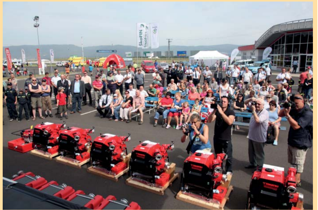
Místo na mosteckém polygonu, kde se předávaly dary a také se koncertovalo a soutěžilo

a Slezska Krajské sdružení hasičů – kraj Ústecký (1,135 mil. korun). Peníze budou využity pro nákup dalšího potřebného vybavení a techniky.