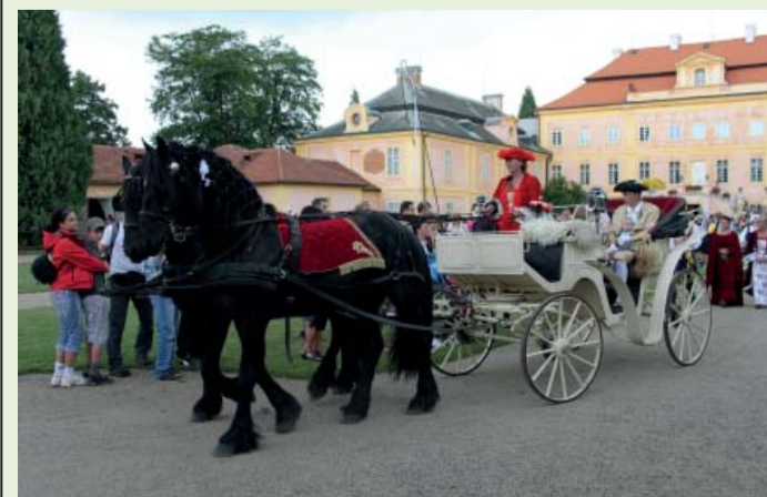
Alespoň jedna fotka z Krásného Dvora: opravdová svatba v dobovém provedení...

významnou akci cestovního ruchu a poznávání historie finančně podpořil z letošního dotačního titulu – z Fondu ÚK. Letošní léto je opravdu nemilodrné; kvůli dešti nemohla být sobotní akce v plném rozsahu dokončena, a tak přijde brzy náhradní termín. Dva tisíce diváků ze soboty i ti noví se vše podstatné dozvědí na www.krasny-dvur.cz .