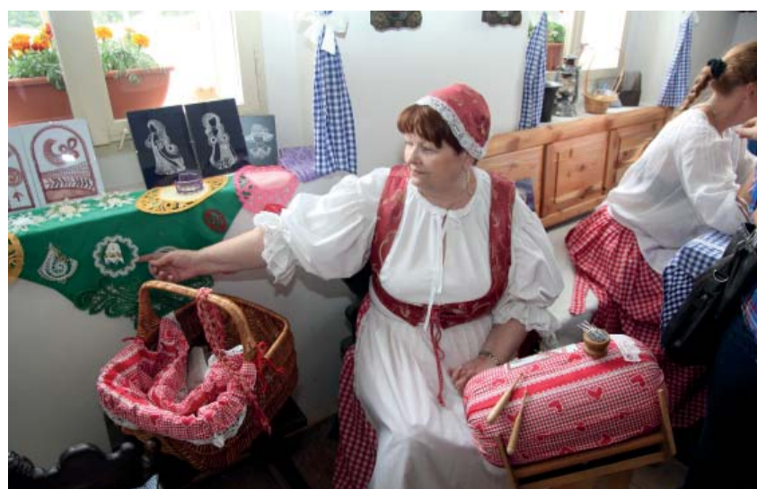
To vše zaznělo také na konferenci o projektu na Červeném hrádku v Jirkově. Po ní následovala poznávací cesta. Hned prvním bodem programu byla prohlídka zámku Červený Hrádek a pak se pokračovalo do horského areálu Lesná, kde kromě hotelu sídlí dobový krušnohorský dům, který reprezentuje život lidí v Krušných horách před sto lety (na snímku). Poté účastníci přešli na německou stranu do města Seiffenu...

ohledu na hranice obou států. Je proto možné si díky nim naplánovat trasu tak, že se během výletu turisté podívají jak do Ústeckého kraje, tak do Saska, a všechny informace najdou na jednom místě. Spolupráce těchto regionů je logickým krokem, protože lidé k sobě mají blízko a za atraktivním výletem nemusí cestovat nikam daleko. Web už je v provozu, ale bude postupně doplňován a aktualizován.