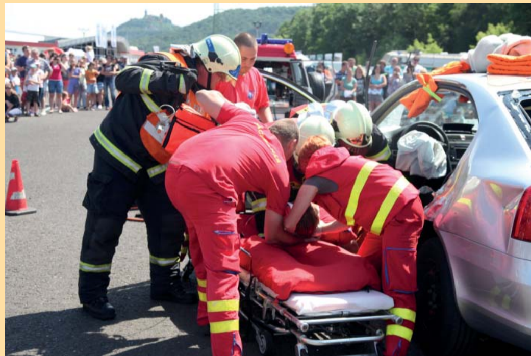
Velmi akční a dramatická scéna záchraný posádky z havarovaného auta