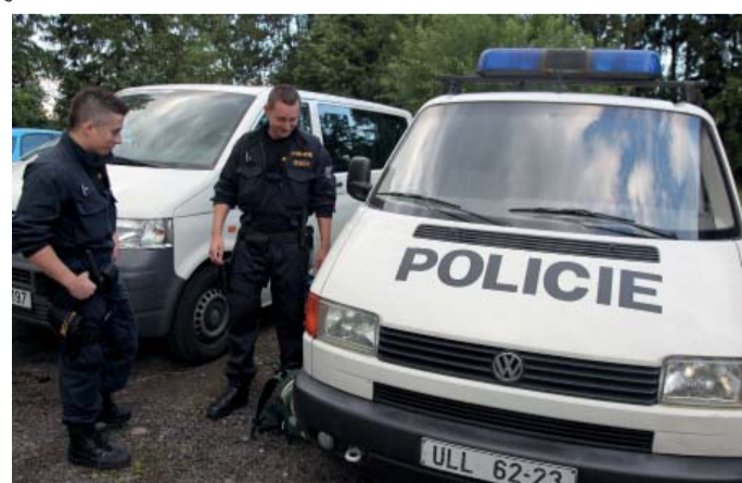
Po regionu Šluknovského výběžku se rozjíždí pět hlídek - do Varnsdorfu, Šluknova, Rumburku, Jiřikova, další budou operovat třeba v Krásné Lípě nebo Velkém Šenovu...