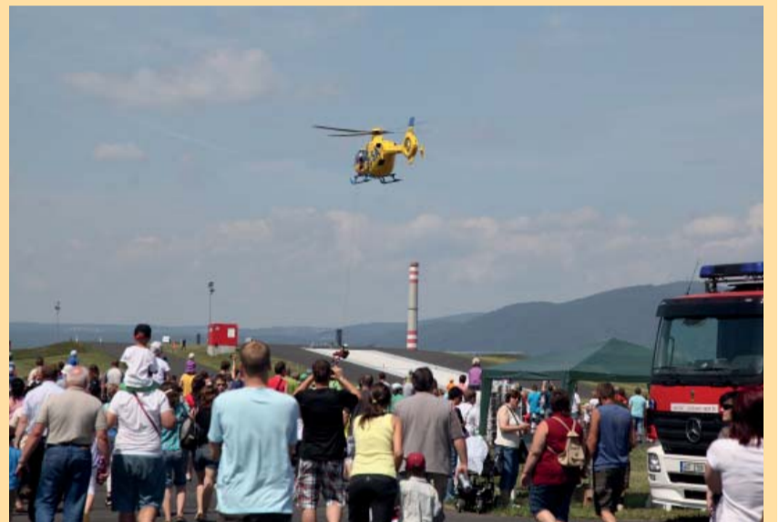
Atrakcí z největších bylo slaňování záchranářů z vrtulníku

Dále bylo předáno sedm motorových stříkaček TOHATSU VC85BS v hodnotě 238 680 Kč. Dar obdržel Sdružení hasičů Čech, Moravy a Slezska Krajské sdružení hasičů – kraj Ústecký, a to Česká Kamenice, Chřibská, Bohušovice nad Ohří, Líšťany, Braňany a Duchcov. Město Litvínov obdrželo nafukovací člun Bombard Typhoon 420S. Další 50 plovoucích čerpadel AMPHIBIO 1500/GXV 390 si obce a jednotky Sborů dobrovolných hasičů obcí Ústeckého kraje vyzvedávaly v průběhu celého dne. Sedm desítek obcí pak obdržel od Ústeckého kraje Pracovní stejnokroj PS II (celkem 319 ks v celkové částce 353 tis. Kč), které si vyzvednou na krajském úřadě.