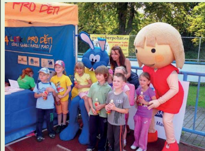
Malí a mladí sportovci si také v Bílině oblíbili maskota projektu – zajíce Atika.

Stěžejní akcí ApD bude letos akce u příležitosti slavnostního otevření nového atletického stadionu v Chomutově dne 10. září, které se zúčastní přední čeští olympionici a představitelé všech spolupracujících partnerských subjektů.