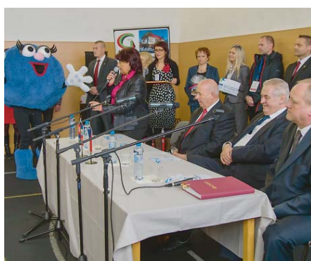
NA BESEDĚ SE STUDENTY bílinského gymnázia byl náměstkyní hejtmána Ústeckého kraje Janou Vaňhovou prezident oficiálně pozván na lednovou olympiádu dětí a mládeže. Přítomný byl i maskot her Bambu.