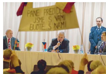
NA SETKÁNÍ a veřejné besedě v Lovosicích měl prezident v publiku i své sympatizanty.