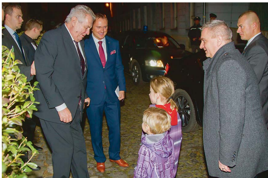
NA MILOŠE ZEMANA čekali v Benešově nad Ploučnicí budoucí voliči.