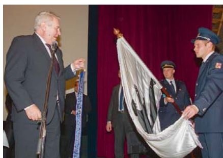
V KAŽDÉM MĚSTĚ , které Miloš Zeman navštívil, pověsil prezidentskou stuhu na městský prapor. Nejinak tomu bylo i v Benešově nad Ploučnicí.