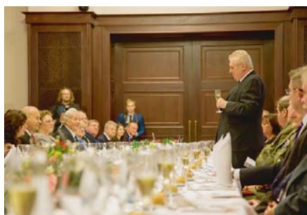
NA VĚTRUŠI se hlava státu v rámci slavnostní večere setkala s významnými osobnostmi regionu.