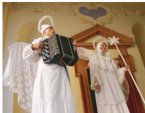
ANDĚLÉ na chůdách z Divadla Kvelb