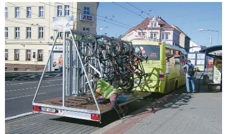
Zelené autobusy linek Dopravy Ústeckého kraje, které umožňují přepravu jízdních kol, opatří dopravci nástavbami nebo vlekly pro kola opět od dubna do října 2016. Informační brožurky s jízdními řády linek pro cyklisty budou během cyklistické sezony k dispozici ve všech informačních kancelářích dopravců DÚK, v turistických informačních centrech měst a obcí nebo v elektronické formě na dopravním portálu www.dopravauk.cz . Připravil: Ing. Miroslav Müller, Odbor dopravy a silničního hospodářství

R ozšířenou možnost přepravy jízdních kol autobusy Dopravy Ústeckého kraje využilo v uplynulém letní sezoně na pět tisíc milovníků cyklistiky. O drtivou většinu přepravených cyklistů se během letošní sezony postaraly autobusy Dopravy Ústeckého kraje směřující do Krušných hor. Ze 14 nejvytíženějších cyklobusových linek jich deset vyvázelo cestujícími z jízdními koly právě na krušnohorské vrcholy. Největším cyklistickým „tahákem“ byly linky 484 z Teplic na Komáří vřku, 433 z Děčína na Sněžník a 493 z Teplic na Moldava v Krušných horách - v roce 2015 se postaraly o třetinu přepravených cyklistů. Trojici nejoblíbenějších cyklobusů následovaly spoje do Tisá a Mukařova, Jetřichovic, Českého Jiřetína, Méděnce, Hory Svatého Sebestiána nebo na Boží Dar. „Mezi spoji, kterými vozíme kola, vládnu jednoznačně ty linky, kde dokážeme vyvézt cyklisty z údolí na kopec – ať už je to v Krušných horách, Českém středohoří, nebo Českém Svýcarsku. Doufám, že v příští sezoně začnou objevovat kouzlo pohodlné a levné veřejné dopravy do zajímavých míst regionu i další příznivci cyklistiky,“ dodává radní pro dopravu Ústeckého kraje Jaroslav Komínek.