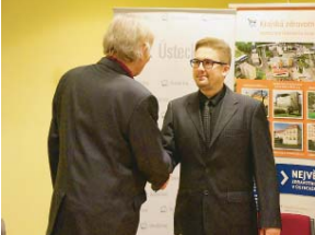
1. NÁMĚSTEK hejtmána Stanislav Rybák (vlevo) blahopřeje studentům ke stipendium.

V prostorách Krajského úřadu Ústeckého kraje došlo 4. prosince 2015 ke slavnostnímu podpisu smluv mezi Ústeckým krajem jako poskytovatelem stipendií, budoucím zaměstnavatelem Krajskou zdravotní, a. s. a vybráními mediky, kteří se zavázali pracovat v této instituci. Studenty, které bude kraj po dobu náročného studia finančně podporovat, tak aby po ukončení studií a specializačního vzdělávání mohli poskytovat kvalitní lékařskou péči v rámci pěti nemocnic Krajské zdravotní, přivítal 1. náměstek hejtmána Stanislav Rybák. „Přejí vám všem především zdárné dokončení studií na vysokých školách a poté i mnoho pracovních úspěchů zde v nemocnicích Ústeckého kraje,“ řekl náměstek Rybák směrem ke studentům. Studenty, které bude kraj po dobu náročného studia finančně podporovat, tak aby po ukončení studií a specializačního vzdělávání mohli poskytovat kvalitní lékařskou péči v rámci pěti nemocnic Krajské zdravotní, přivítal 1. náměstek hejtmána Stanislav Rybák. „Přejí vám všem především zdárné dokončení studií na vysokých školách a poté i mnoho pracovních úspěchů zde v nemocnicích Ústeckého kraje,“ řekl náměstek Rybák směrem ke studentům.