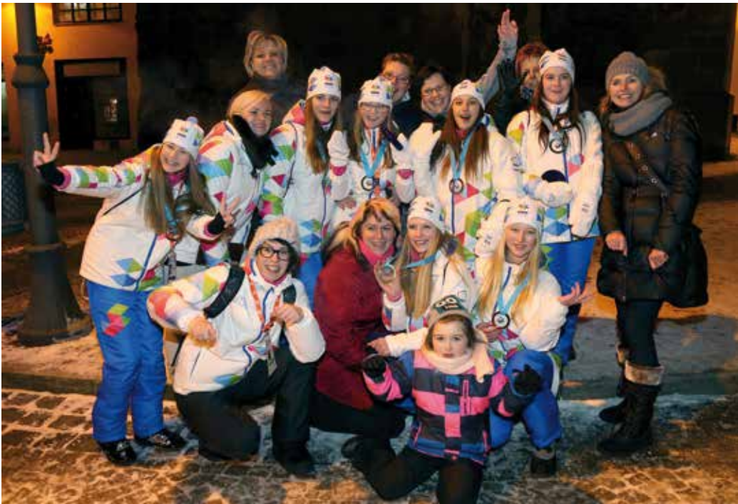
TANEČNICE Z ÚSTECKÉHO KRAJE získaly medaile v doprovodné disciplíně olympiády v discodance.