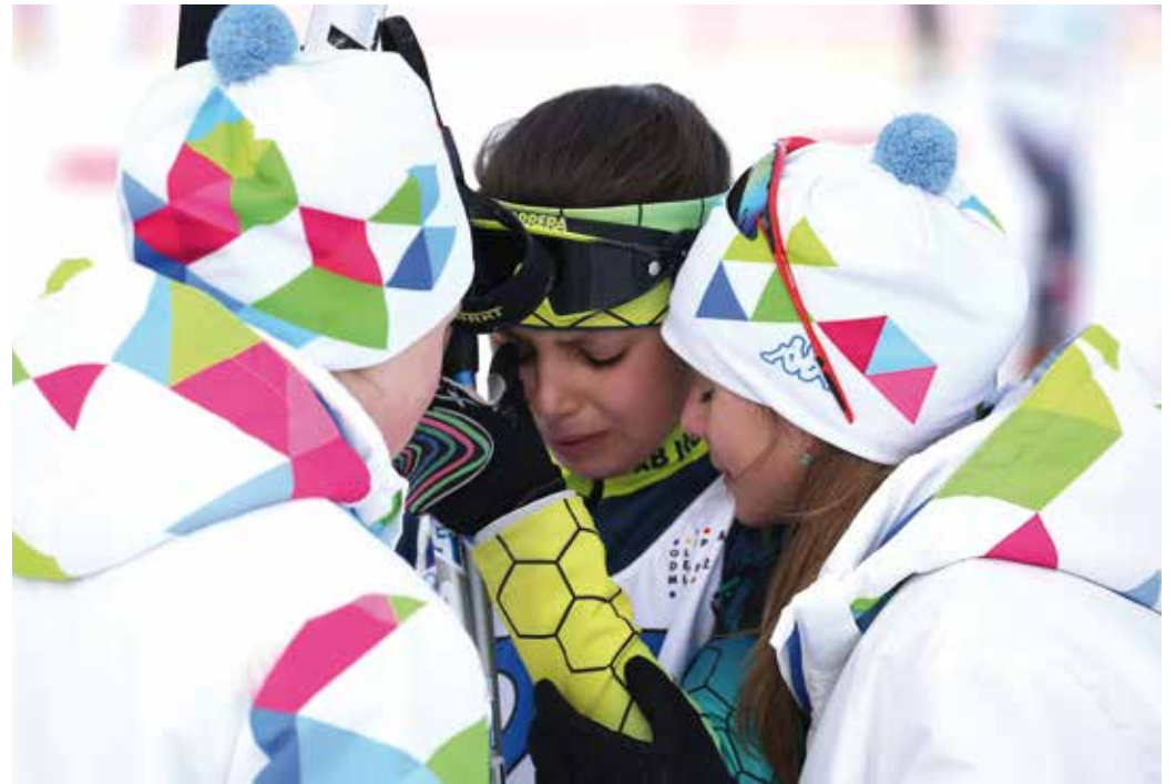
PO ZÁVODĚ byli někteří účastníci zklamaní.