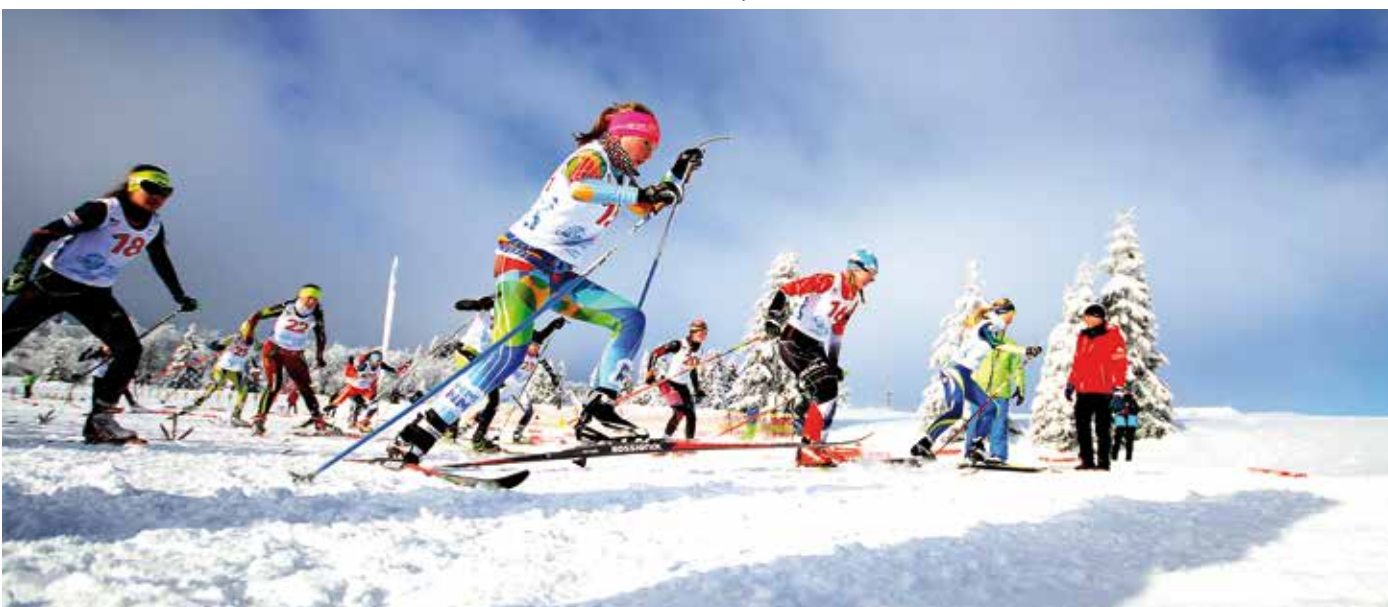
BĚŽKAŘŮM přálo na Cínovci počasí.