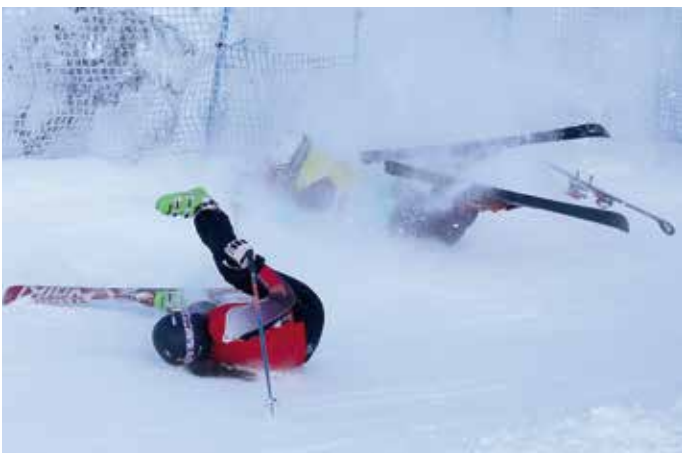
OLYMPIJSKÉ ZÁPOLENÍ občas bolelo. Přesvědčili se o tom závodníci ve skikrosu.