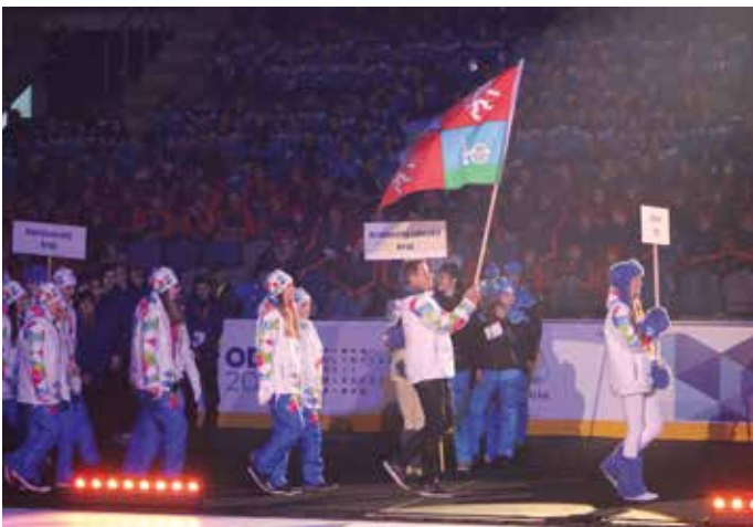
ÚSTECKÝ KRAJ vedl na slavnostním ceremoniálu olympiády skikrosář Tomáš Kraus. Ten poté zapálil i olympijský oheň.