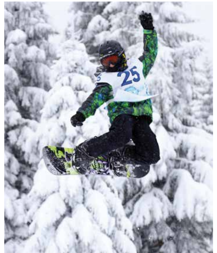
SNOWBOARDISTÉ si to na Klínovci užívali.