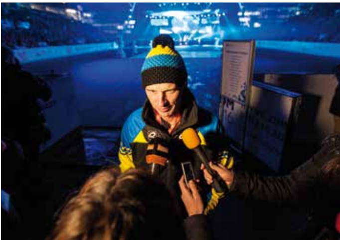
VLAJKONOŠEM Pardubického kraje byla legenda českého hokeje brankář Dominik Hašek.