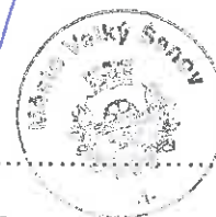
Poskytovatel Ústecký kraj Oldřich Bubeníček, hejtmán kraje