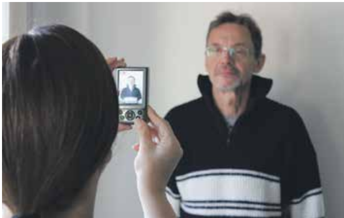
V RÁMCÍ REGISTRACE při castingu byl každý účastník vyfocen do databáze.