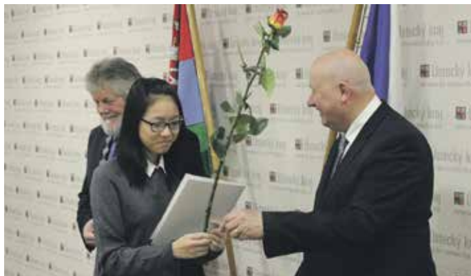
HEJTMÁN ÚSTECKÉHO KRAJE Oldřich Bubeníček přijal na úřadě nové občany České republiky.

Žádosti o udělení státních občanství ČR podle § 11 zákona 186/2013 Sb. nabírají pracovníci odboru správních činností od žadatelů, kteří mají trvalý pobyt na území Ústeckého kraje a posílají je k vyřízení na Ministerstvo vnitra ČR. V roce 2017 ředitel krajského úřadu Milan Zemaník udělil státní občanství čtyřem stovkám lidí, kteří následně složili svůj slib.