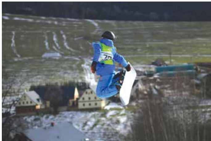
SNĚHU V PARDUBICKÉM KRAJI v čas konání her moc nebylo, ale i tak si to sportovci užili.