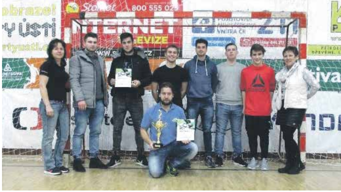
VÍTEZNÉ MUŽSTVO kluků z ústecké stavárny.