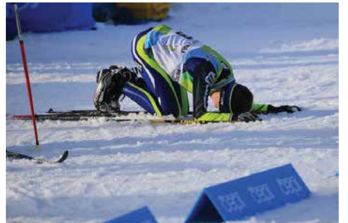
PRO NĚKTERÉ ZÁVODNÍKY byly závody vyčerpávající.