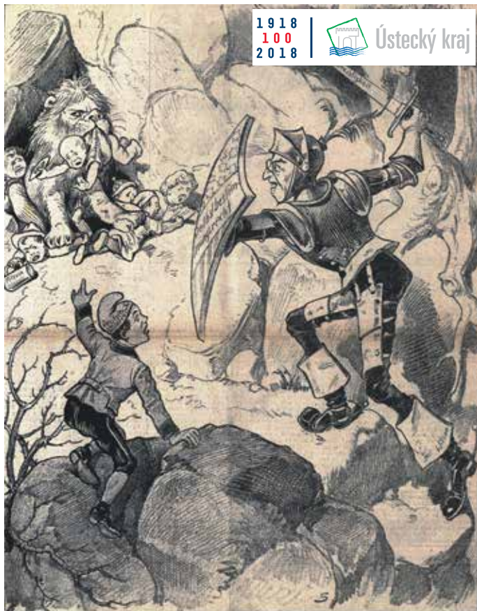
KARIKATURA ze satirického časopisu Kikeriki z Vídně (vydáno v lednu 1919).

Výstava potrvá do 5. dubna. Dornířská výstava bude spojena s krajským kolem dějepisné olympiády pro gymnázia Ústeckého kraje, kterou katedra historie FF UJEP pořádá ve spolupráci s Krajským úřadem Ústeckého kraje. Výstava se poté představí krom vybraných gymnázií také v Severočeském divadle opery a baletu v Ústí nad Labem, na Hradě v Litoměřicích, v Oblastním muzeu v Chomutově i na dalších místech. Zájemcům o danou problematiku bude k dispozici i výstavní katalog.