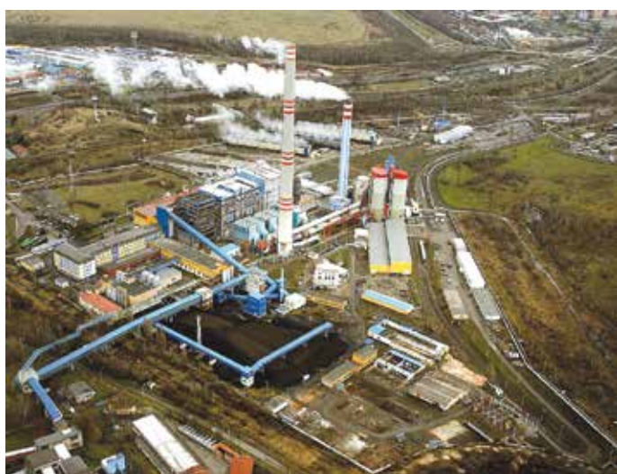
LEDVICKÁ ELEKTRÁRNA z ptačí perspektivy.