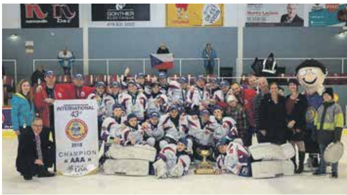
MISTŘI. Hokejisté reprezentovali v Kanadě Ústecký kraj.