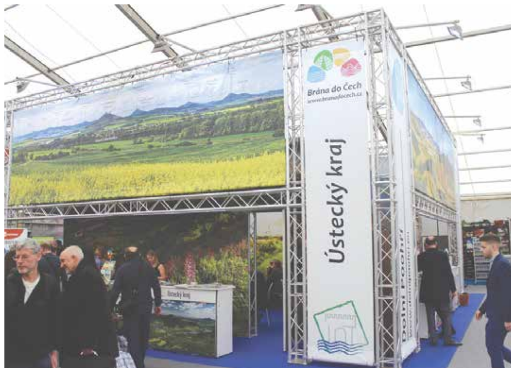
NEJVĚTŠÍM „STÁNKEM“ ze všech přítomných krajů ČR se mohl pyšnit ten Ústecký.

Ústecký „stánek“ nabídl příchozím kromě prospektů ze