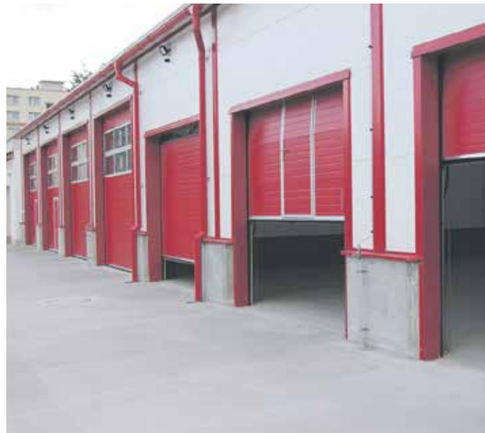
KRAJ PŘISPĚL na stavbu haly pět milionů korun.

Hala bude sloužit pro uskladnění požární techniky. Umístěn tam bude tankovací kontejner, nákladní kontejner, kontejner nouzového přežití, hadicový přívěs, nákladní přívěs pro odvoz havarovaných vozidel, dopravní automobil, užitkový automobil k dopravě materiálu, vysokozdvizný vozík a osobní automobily určené pro plnění služebních úkolů.