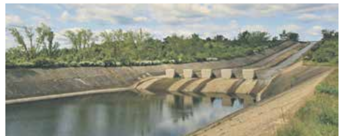
SKLUZ na vodním díle Nechranice.

Zpřístupněna budou vodní díla Skalka, Stanovice, Chřibská. Den otevřených dveří je tradičním prvkem, který má v letošním roce také vazbu na Dny evropského dědictví a u té příležitosti bude zpřístupněno vodní dílo Nechranice, které v letošním roce slaví 50 let od zprovoznění.