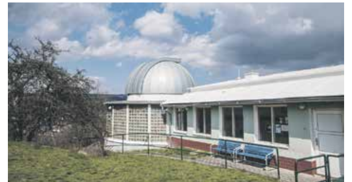
TAKTO vypadala hvězdárna před rekonstrukcí...

Součástí hvězdárny je také planetárium. Důležitou složkou činnosti obou institucí je spolupráce se školami a pořádání přednášek pro školy.