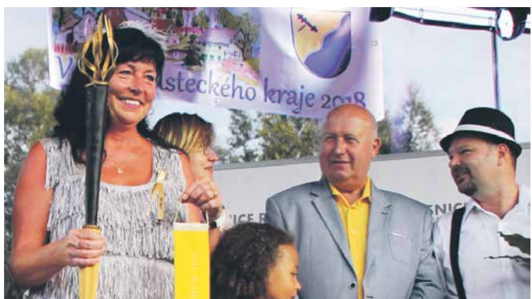
HEJTMAN ÚSTECKÉHO KRAJE předal starostce vítězné obce stuhu a diplom za prvenství.

Přihlášené obce jsou hodnoceny v následujících oblastech: společenský život, aktivity občanů, podnikání, péče o stavební fond a obraz vesnice, občanská vybavenost, inženýrské sítě a úspory energií, péče o veřejná prostranství, přírodní prvky a zeleň v obci, péče o krajinu, připravované změry a informační technologie obce a koncepční dokumenty.