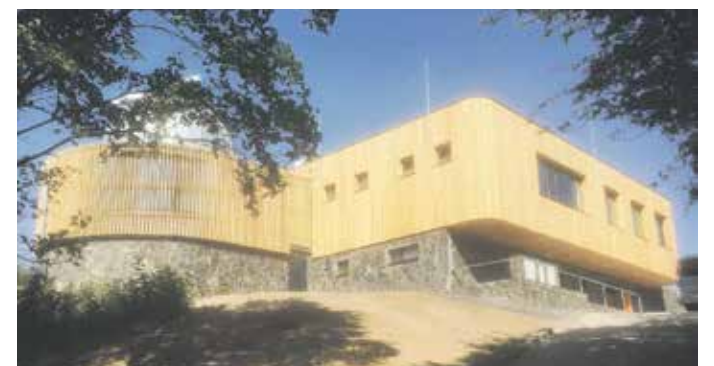
...A TAK vypadá dnes.