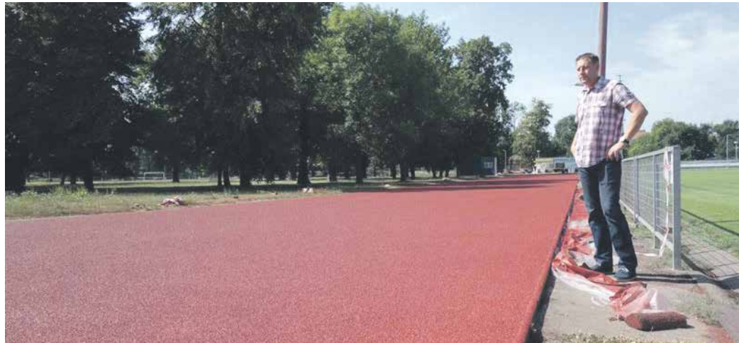
ZCELA NOVÝ POVRCH dělá sportovcům radost.

ny. Oprava dráhy město Lovosice vyšla na 1 450 000 Kč, z čehož 500 000 Kč činila dotace z Krajského úřadu Ústeckého kraje. Sportovní areál slouží především pro trénink a závody atletického klubu ASK Lovosice, pro trénink ostatních sportovních oddílů a doplnkově pro hodiny tělesné výchovy lovosických škol.