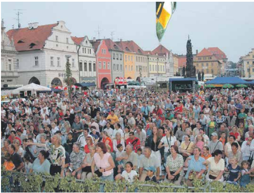
LETOS BUDE na dočesné plně náměstí.

Letos se na pódiu vystřídá řada zajímavých zpěváků, zpěvaček či kapel – Marie Rottrová, Olga Lounová, Xindl X se Sabinou Křovákovou, Petr Spálený, Ondřej Havelka, Ivan Hlas Trio a další. Zábavný program doplní soutěž v tanci s korbelem piva na hlavě či v česání chmele na čas. Vstup je zdarma.