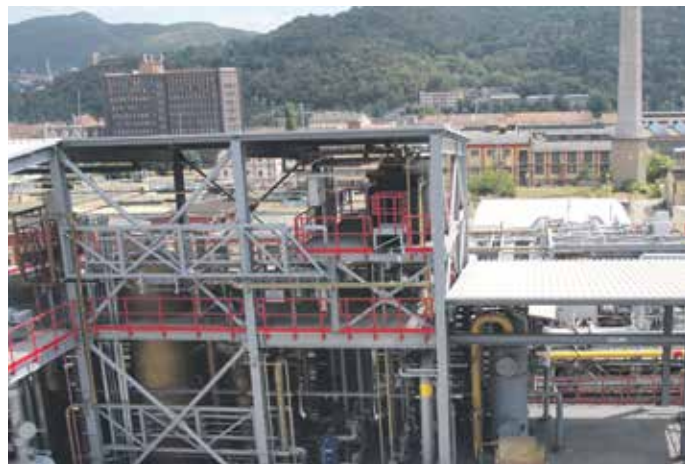
PROVOZ STÁL chemičku dvě miliardy korun.

Dobrou zprávou také je, že firma prošla rozsáhlou modernizací, která přinesla snížení dopadů na životní prostředí a nové technologie s sebou nesou i nové bezpečnostní standardy. Vítám také spolupráci chemičky s vysokými školami, což ve svém výsledku posílí strategii firmy v oblasti výzkumu, vývoje a inovací,“ zhodnotil postavení Spolchemie hejtman Oldřich Bubeníček.