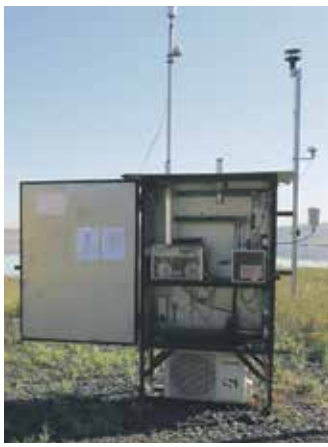
V REGIONU je takových měřících stanic víc.

Měření jsou základní meteorologické veličiny a koncentrace aerosolových částic PM10. Pro účely