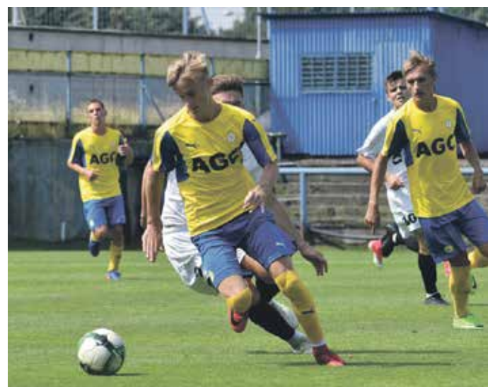
TEPLIČTÍ FOTBALISTÉ se rvají o co nejlepší umístění, i tak je čtvrté místo velmi pěkné.