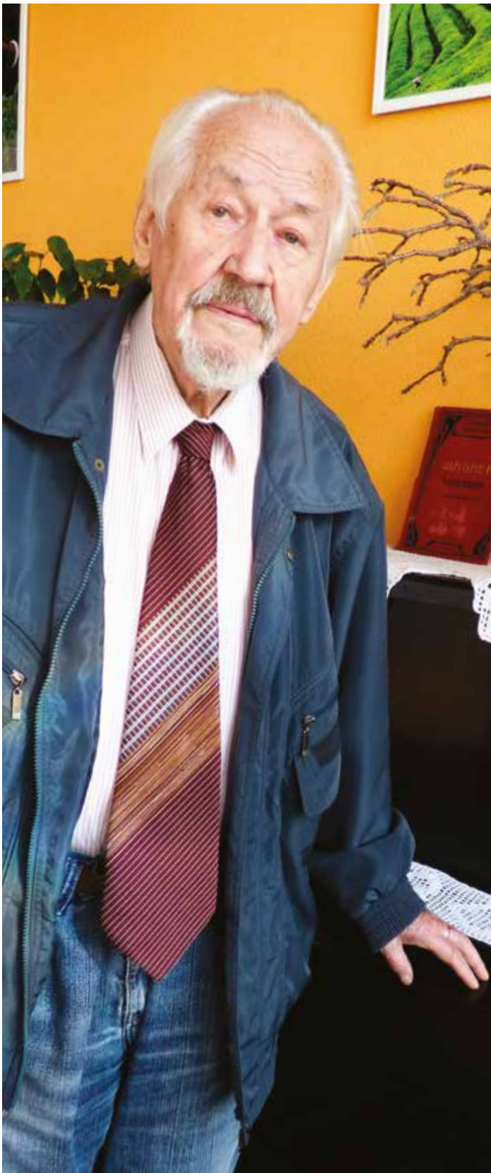
Operní zpěvák a spisovatel slavil devadesátku a jeho životní energii mu lze jen závidět.

děti ještě divadelní hru, kterou třeba teplické divadlo hrálo jako muzikál, bylo to O pihovaté princezně.