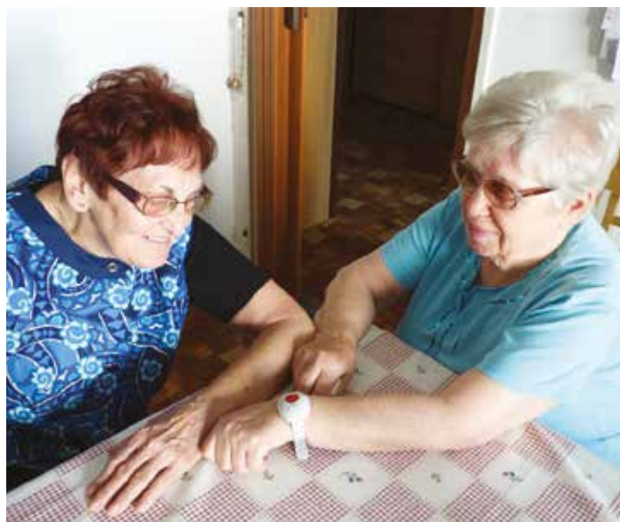
Zatím se tlačítka testují v jednom domově pro seniory v Krupce.

„Signál z jednotlivých tlačítek se bude zobrazovat na operačním středisku Městské policie v Krupce. Strážníci se spojí s konkrétní osobou, která si vyžádala pomoc, a následně učiní nezbytné kroky, které povedou k zajištění