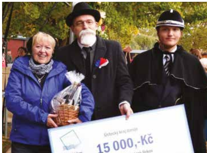
Nejaktivnějším klubem seniorů byl vloni vyhlášen ten z Jirkova.