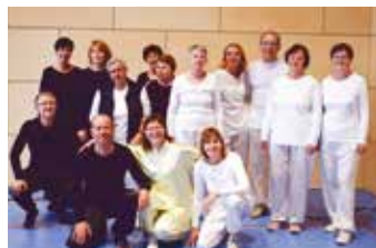
Účastníci kurzu Čínská cvičení pro zdraví – Tai-chi pro pokročilé.

Pro univerzitu je to nejen příjemná motivace, ale i důkaz, že v našem kraji si starší generace rozhodně neplánuje pasivně stárnout. U3V nabízí nestárnoucím seniorům nepřeberné množství zajímavých kurzů v oblastech cizích jazyků, umění a kultury, českého jazyka a literatury, cvičení a sportu, informačních technologií, základů práce na PC, fotografování, ekonomie,