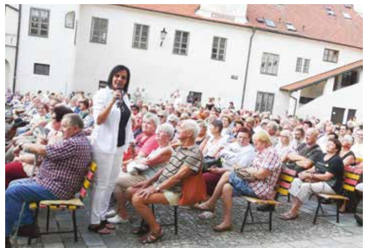
Senioři jsou nejčastější a nejděčnější publikum.