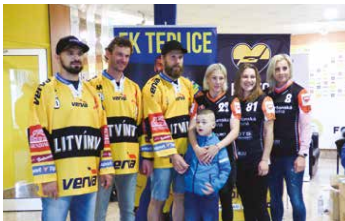
S teplickým fotbalovým klubem se do projektu zapojili i hokejisté z Litvínova a mostecké házenkářky.