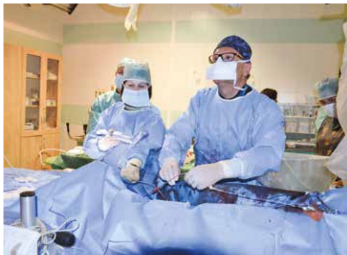
Kardiozárok TAVI + MitraClip, tedy výměnu dvou srdečních chlopní najednou, provedl tým kardiokliniky v ústecké Masarykově nemocnici jako první ve střední a východní Evropě.

Centrum vysoce specializované kardiovaskulární péče patří mezi šest akreditovaných center vysoce specializované péče s tímto zaměřením v České republice.