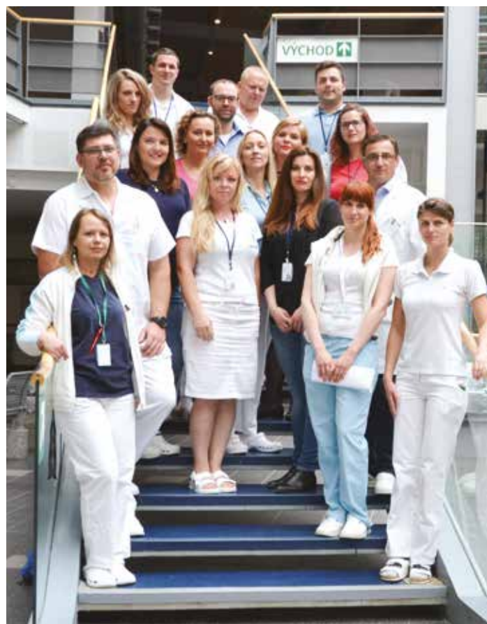
Část postupně se rozrůstajícího kardiocentru v květnu 2019.

Krajská zdravotní, a. s., rozšířila spolupráci s vybranými pražskými pracovišti. Memorandum o spolupráci podepsali zástupci Institutu klinické a experimentální medicíny (IKEM) a Krajské zdravotní, a. s. Zaměřena bude na oblast kardiovaskulární chirurgie pro Masarykovu nemocnici v Ústí nad Labem. V dohodnutých případech bude IKEM poskytovat pacientům Krajské zdravotní, a. s., specializovanou akutní a elektivní péči v oboru kardiovaskulární chirurgie. Obě zdravotnická zařízení si