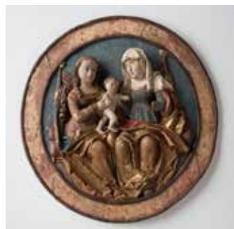
TONDO se sv. Annou Samotřetí.

Základem předloženého projektu jsou na české straně vybraná umělecká díla z muzeí Ústeckého kraje pocházející z let 1400-1540. Jedná se o Madonu z Krupky, Trůnící Madonu z Litvínova, Votivní desku mosteckou od Mistra IW,