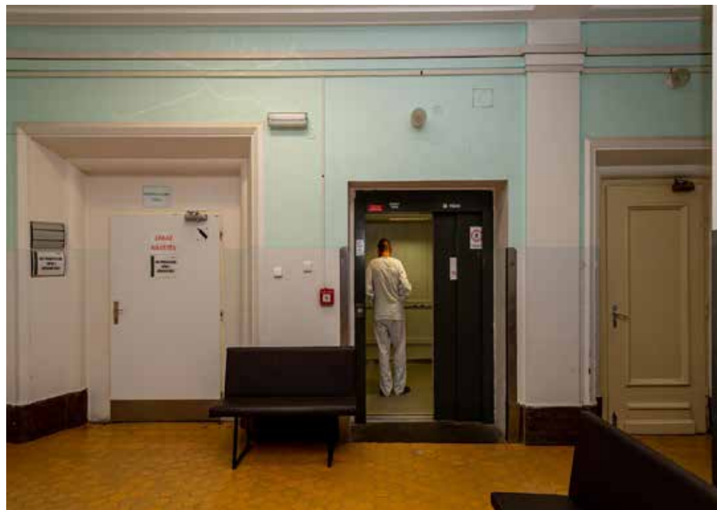
ÚSTECKÝ KRAJ nyní nemocnici koupil