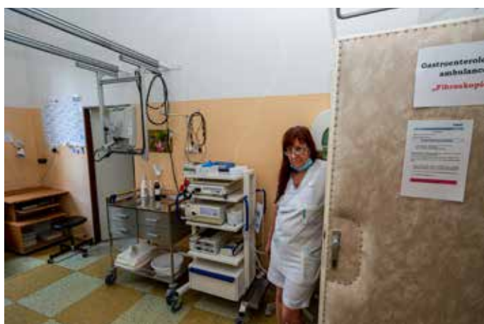
ZAMĚSTNANCI Lužické nemocnice na jednotlivých odděleních