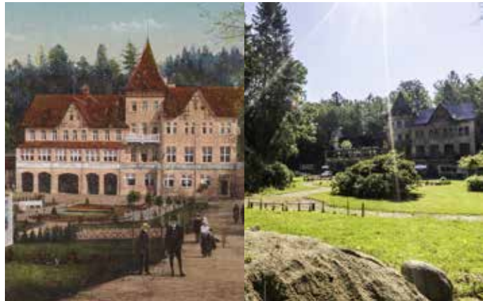
TAKTO VYPADALO Karlovo údolí kdysi a takto dnes.

Novodobá historie Karlova údolí začala posledním prodejem v roce 2017. Záměrem současných majitelů je obnova areálu do původní podoby z počátku minulého století. Aktuálně si již můžete posedět v parku nebo ve stínu repliky původního altánu, vychutnat si procházku přírodou podél obnovených vodotečí a sledovat postup obnovy areálu s přibývajícím zajímavostmi skýtajícími nové zážitky.