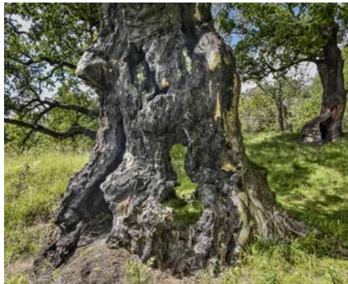
DUB ZE ŽIŽELIC je starý 450 let.

930 centimetrů. Celostátní anketu letos již po devatenácté pořádá pod záštitou Ministerstva životního prostředí Nadace Partnerství. Ta letos obdržela více než 50 návrhů na Strom roku, z nichž odborná porota do finále vybrala 12. Podpořit oblíbený strom lze do 11. října 2020 v Brně.