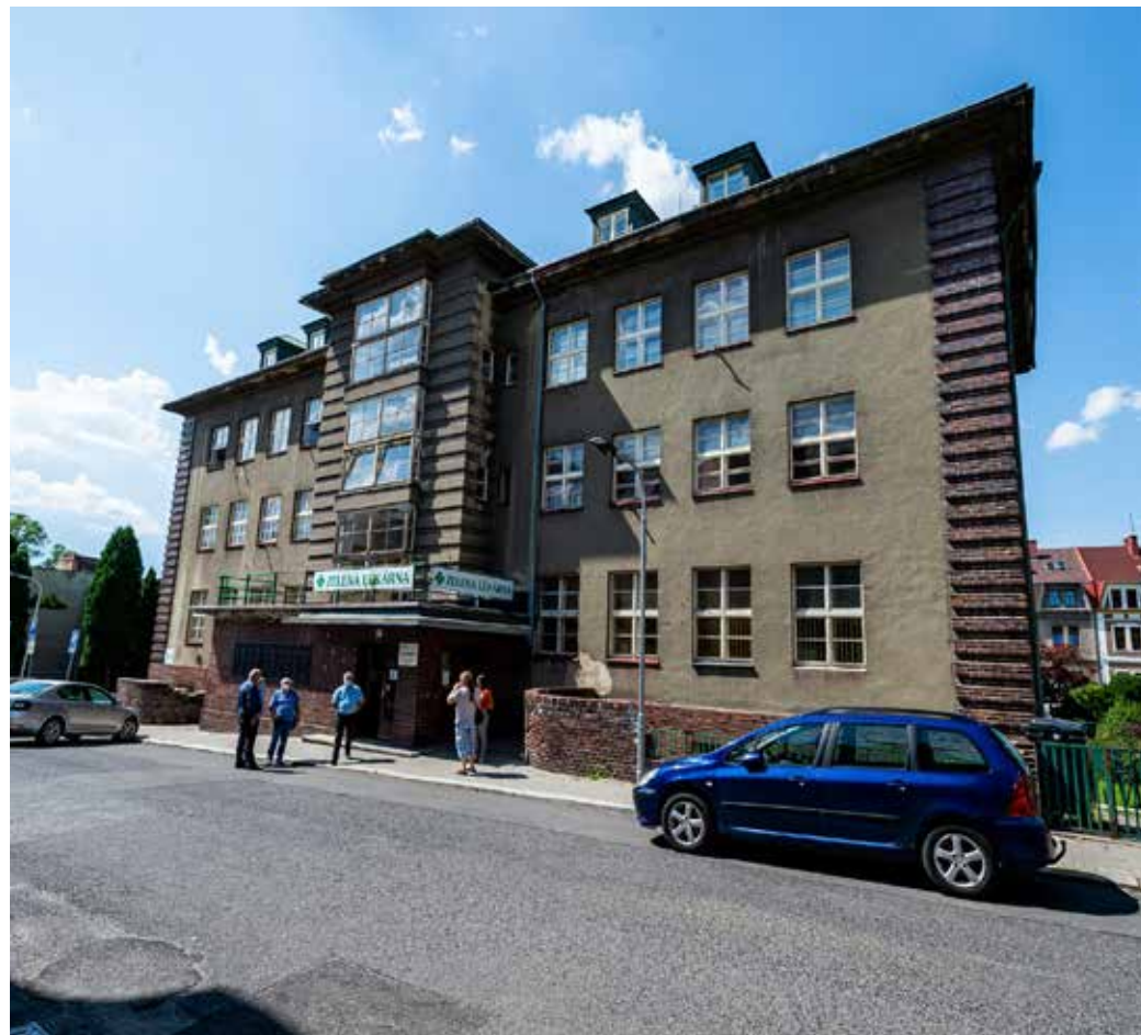
POLIKLINIKA v Rumburku.