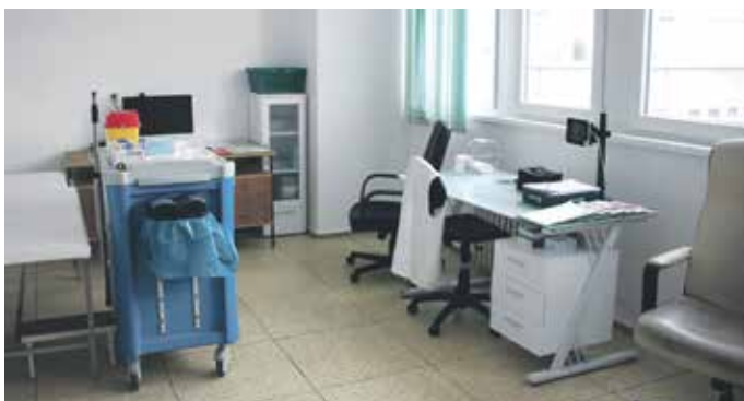
ROUDNICKÁ NEMOCNICE disponuje veškerým potřebným vybavením pro očkování.