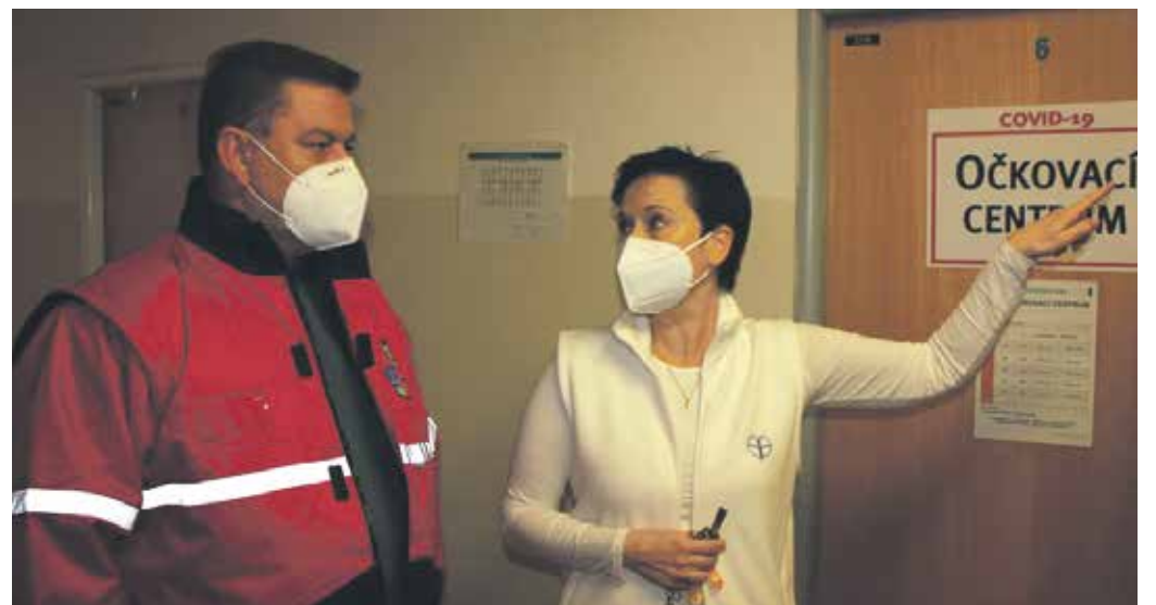
V KAŽDÉM ZDRAVOTNICKÉM ZAŘÍZENÍ jsou na očkování připraveni. Kraj chce však sjednotit grafický manuál, aby se lidé v nemocnicích a ve velkokapacitních centrech lépe orientovali.

V Děčíně, stejně jako v ostatních navštívených nemocnicích, se hejtman zajímal o počty pacientů hospitalizovaných s COVID-19. V současné době není překročena kapacita vyhrazených lůžek, situace je stále vážná, ale ne kritická, shodli se ředitelé nemocnic.