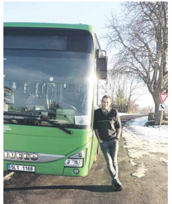
JEHO PRÁCE ho naplňuje a je vždy rád, když jsou cestující spokojeni.

Z výčtu nejzajímavějších případů, které dispečink zaznamenal, je patrné, že ačkoliv řidiči spojů DÚK i dispečeri dělají maximum, ani veřejná doprava není zachráněním cestujících, když počasí není na naší straně. Ale cestující se mají kam obrátit. Krajský dispečink řešil v nejnepříznivějších dnech i téměř třicet pět provozních odchylek spojů DÚK za den. Kontakt na dispečink je 475 657 657.