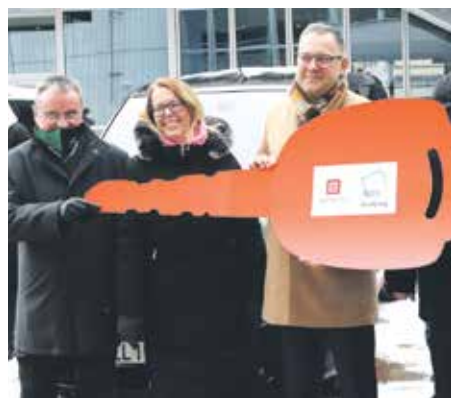
SYMBOLICKÝ KLÍČ od 24 předaných vozidel.

krajského úřadu již několik let. Dlouhodobě podporuje kraj i vznik nových dobíjecích stanic. Již dva roky mohou výhody elektromobilů využít pro svou náročnou práci i pracovníci v sociálních službách a ve školských zařízeních. Všechna auta byla vybrána tak,