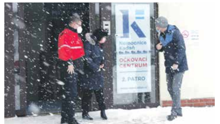
DO KADANĚ dorazil vakcinační tým za hustého sněžení.