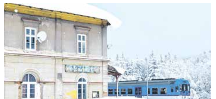
BUDOVA nádraží na Moldavě.

Finanční podíl obce na rekonstrukci budovy představuje 2,5 mil. Kč. Na jeho zajištění byla koncem roku 2020 vyhlášena veřejná sbírka. Transparentní účet: 135444135/2010.