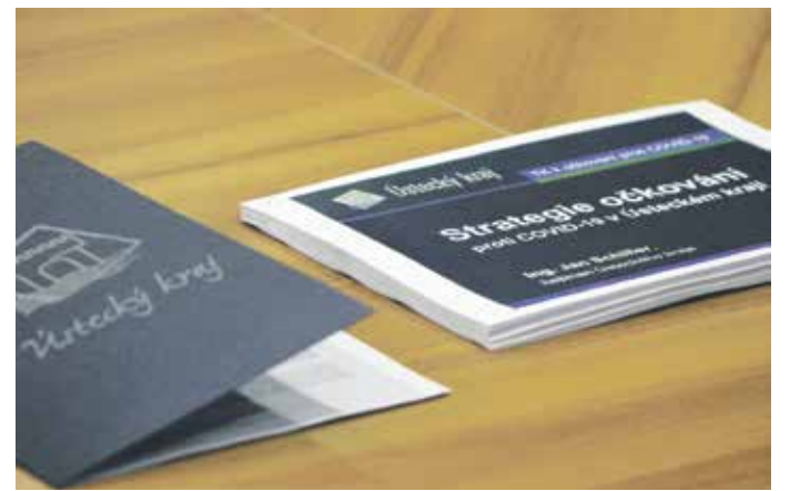
OČKOVÁNÍ v regionu je v procesu.

Více informací najdete na: www.kzcr.eu www.kr-ustecky.cz