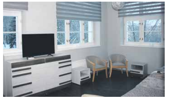
ÚTULNÉ BYDLENÍ je uzpůsobené každému klientovi podle přání.

Projekt je z 95 procent financovaný Evropskou unií a Ústecký kraj ho podpořil rozšířením počtu zaměstnanců v přímé péči. V roce 2017 byl Ústeckým krajem schválen již druhý transformační plán pro příspěvkovo-