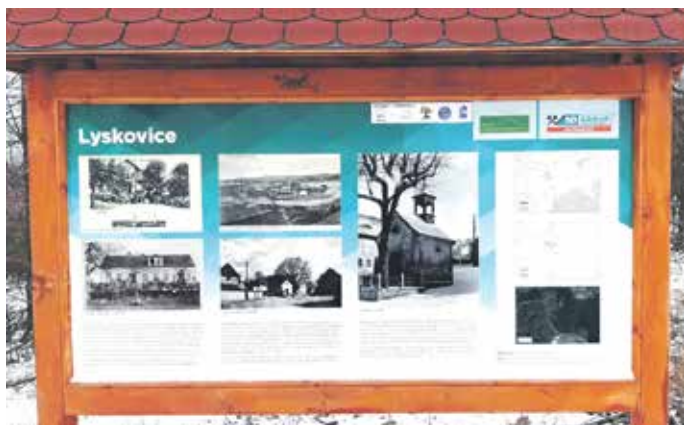
INFORMAČNÍ TABULE zdobí okolí výsypky.

Severočeské doly, a. s., pozemky zasažené důlní činností rekultivují s důrazem na ekologii, zároveň však respektují estetické a sportovní-rekreační zájmy. V současné době se dokončuje silniční propojení přes výsypku z Kostomlat pod Milešovkou do Štěpánova a Razic. Komunikace mezi Kostomlaty a Bílinou je již dnes hojně využívána motoristy, cyklisty i turisty. Krátce před dokončením je cyklostezka, která bude kopírovat komunikaci mezi Bílinou a Kostomlaty.