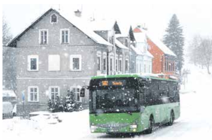
LETOŠNÍ ÚNOROVÉ POČASÍ bylo zkouškou pro řidiče „zelených“ autobusů.

i případy, kdy došlo k nehodám autobusů. V linkové dopravě i na železnici bylo ve velkém množství zpoždění spojů. Takových spojů bylo více než čtyřicet zejména v ranních špičkách, ale zpoždění byla často do 15 minut. Bohužel v linkové dopravě došlo i k neodjetí řady spojů. Kde došlo k takovému větším problémům?