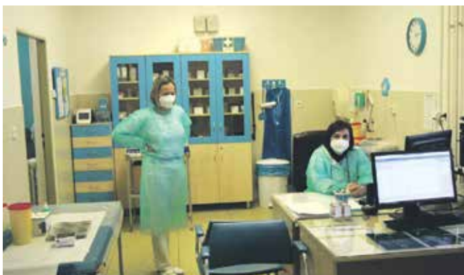
V ŽATECKÉ NEMOCNICI jsou již také připraveni na očkování.