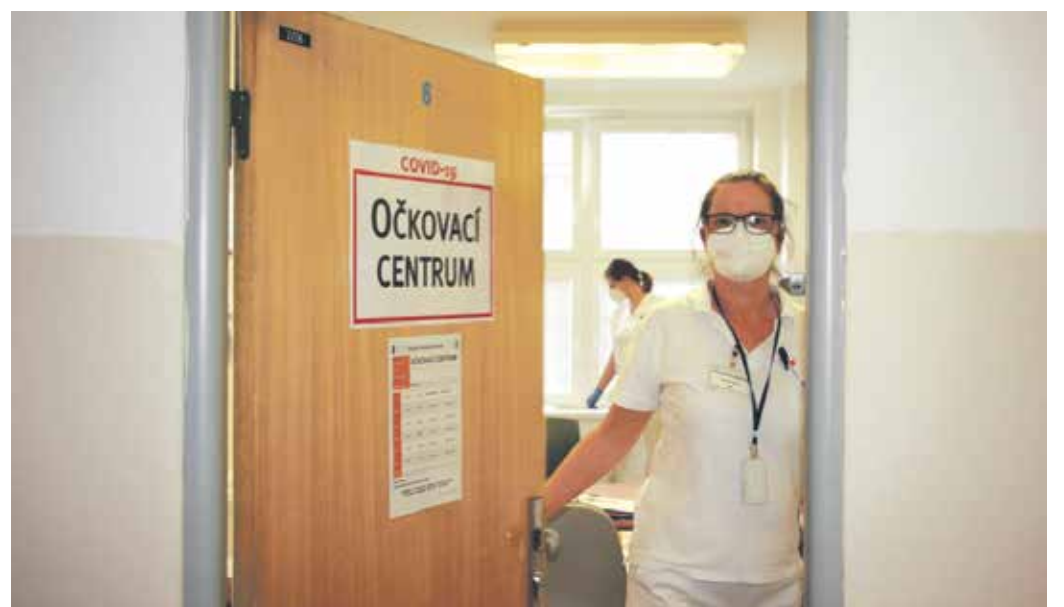
SESTRÍČKY, a nejen ty z Nemocnice Most, o. z., již očkují seniory starší 80 let.