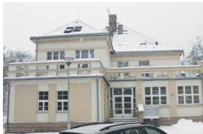
A TAKTO VYPADÁ opravená budova zvenčí.

Všechny byty jsou umístěny v jednom objektu, mají samostatné vchody – jedná se o oddělené bytové jednotky se standardním vybavením. Nachází se zde čtyři domácnosti. Jedna je ryze mužská, ostatní smíšené. Mužů je v bytě šest a mají k dispozici dva dvoulůžkové a dva jednolůžkové pokoje.