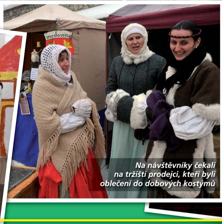
Na návštěvníky čekali na tržišti prodejci, kteří byli oblečení do dobových kostýmů