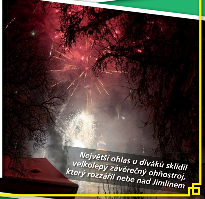
Největší ohlas u diváků sklidil velkolepý závěrečný ohňostroj, který rozzářil nebe nad Jimlínem