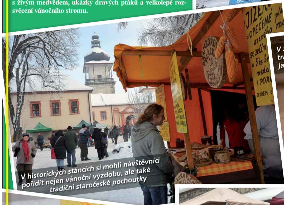
V historických stáncích si mohli návštěvníci pořádit nejen vánoční výzdobu, ale také tradiční staročeské pochoutky