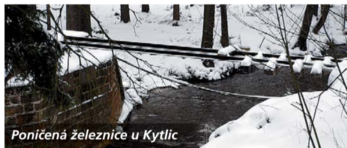
Poničená železnice u Kytlic

Děčínsko - Téměř dvě miliardy korun bude třeba vynaložit na obnovu území po letních povodních na severu Ústeckého kraje, především v podstatné části Děčínska. Tato hrozivá částka představuje hodnotu zničených mostů a silnic, objektů občanů i právnických osob, jsou v ní škody na majetku obcí, ale také kraje a dalších subjektů. Ze šedesáti postižených obcí – měst a větších či menších vesnic, je samozřejmě většina