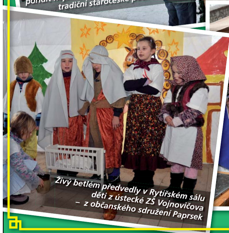
Živý betlém předvedly v Rytířském sálu děti z ústecké ZŠ Vojnovičova - z občanského sdružení Paprsek