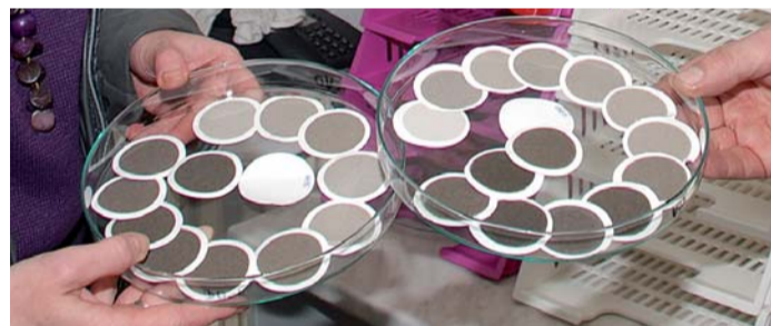
Ukázka pásek s odstíny od bílé přes šedou až k černé barvě. Nejtmavší kolečka jsou z časových úseků, kdy byla situace s polévatým prachem nejhorší...

signál regulace pro zdroje znečišťování ovzduší podle Ústředního regulačního řádu.