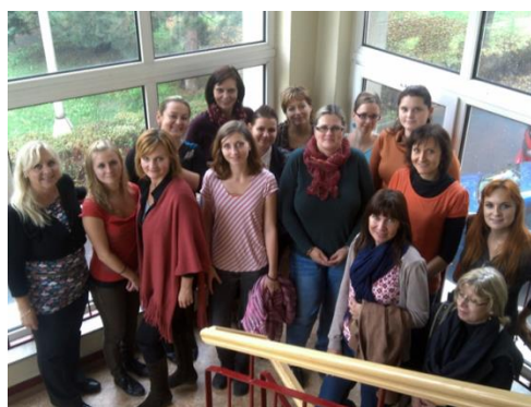
Obrázek 1 a 2: Fotografie zástupců členských organizací