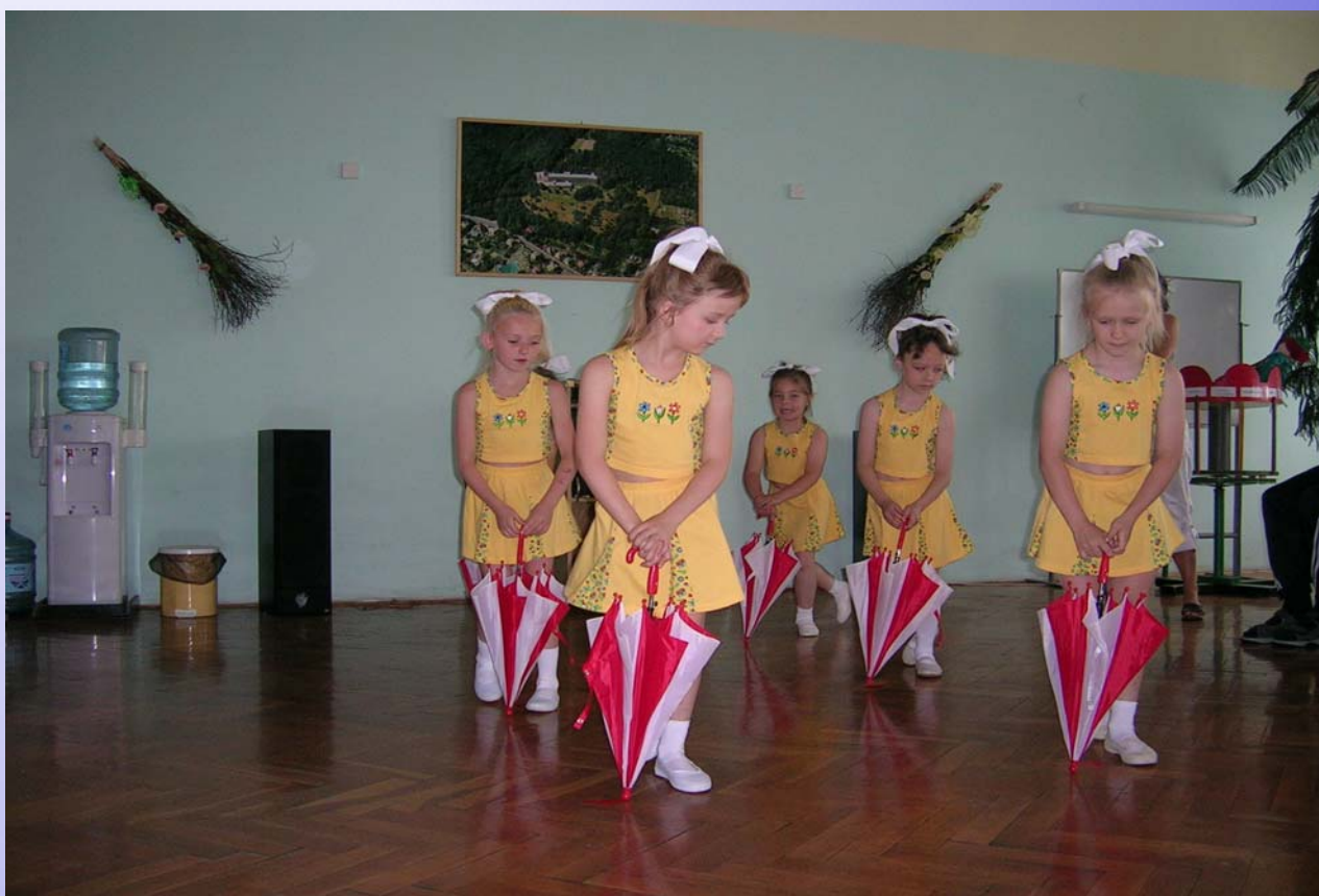
Návštěva dětí z mateřské školy

Pro zajímavost přehled nejzajímavějších Akcí v roce 2005