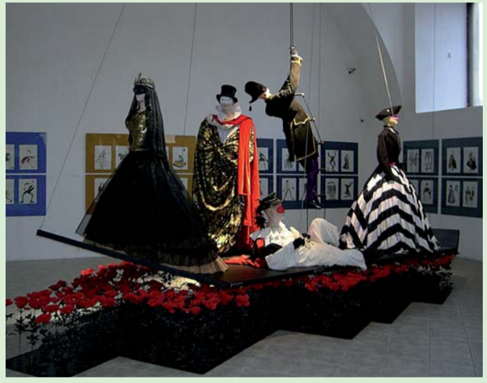
Z výstavy kostýmů a scénografie v Galerii moderního umění v Roudnici nad Labem

Podstatná část z těchto peněz – 126,5 milionu korun, je příspěvkem zřizovatele, tedy Ústeckého kraje, na činnost kulturních institucí. Jejich další příjmy jsou totiž de facto mizivé, například na vstupném do všech našich muzeí bylo vloni vybráno 586 tisíc Kč, do galerií ani ne půl milionu. Přes šest milionů korun je určeno pro Ústav archeologické a památkové péče Severozápadních Čech, veřejnou výzkumnou instituci. Pro výkon regionálních funkcí knihoven bude uvolněno 8 milionů a další miliony v dotačních programech podpory aktivit stálých profesionálních souborů a hudebních těles našeho regionu nebo v dotačním programu Regionální kulturní činnost, kam například patří Trampská porta, Klášterské divadelní žně, filmová soutěž amatérů Střežkovská kamera a celá dlouhá řada dalších akcí přehlídek, festivalů, soutěží či sympozií. S deseti miliony letos počítáme na vybrané akce z Programu na záchranu a obnovu kulturních památek a máme také vytvořenu rezervu přibližně 1,5 mil. Kč na záchraný archeologický výzkum.