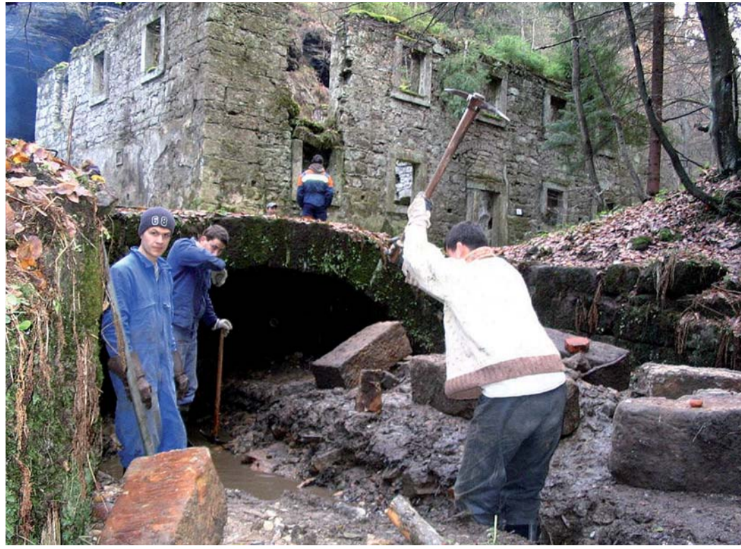
Studenti Vyšší odborné školy a Střední průmyslové školy stavební v Děčíně se ve rámci praktické výuky, ovšem ve svém volnu, zapojují do rekonstrukce Dolského mlýnu

Kamenný mlýn v údolí řeky Kamenice poblíž Jetřichovic na Děčínsku už řadu let opravují brigádníci. Tuto stavbu, která téměř podlela zubu času, zná snad každý Čech, vždyť se u něj v padesátých letech minulého století natáčely scény tehdy i dnes oblíbené filmové pohádky Pyšná princezna. Už na podzim roku 2004 se do záchranu Dolského mlýnu, o jehož existenci jsou písemné zmínky již z roku 1515, zapojili mezi jinými i studenti a pedagogové Vyšší odborné školy a Střední průmyslové školy stavební v Děčíně, která je příspěvkovou organizací Ústeckého kraje. Tehdy i v dalších letech pomáhali ve volném čase zajistit stabilitu stavby – především přední stěny, která hrozila bezprostředním zřícením. Pročišťovali náhon, kde byly naplaveniny včetně pískovcových kvádrů přes metr vysoké. Bylo také nutné podepřít betonovou desku a zajistit základy a současně se stavěla hráz z ptylů s pískem. Provedení prací bylo velice aktuální, protože následující povodeň ochranná opatření narušila, ale stavbu neporušila. Později brigádníci z děčínské školy zvýšili hráz a zesílili podepření desky a základů. Zajištění stavby vydrželo až do opravy mlýnu, kterou prováděla odborná stavební firma. Stu-