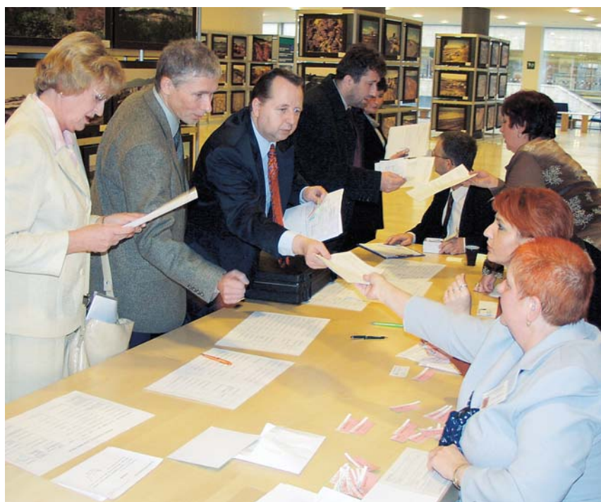
Prezentace zastupitelů před prvním jednáním v novém volebním období

šího vedení kraje budu rád za každý dobrý projekt, který se podaří realizovat. Musíme to chápat tak, že chceme peníze navíc, a o to větší bude radost z projektů, které budou hotové a začnou sloužit našim obyvatelům.