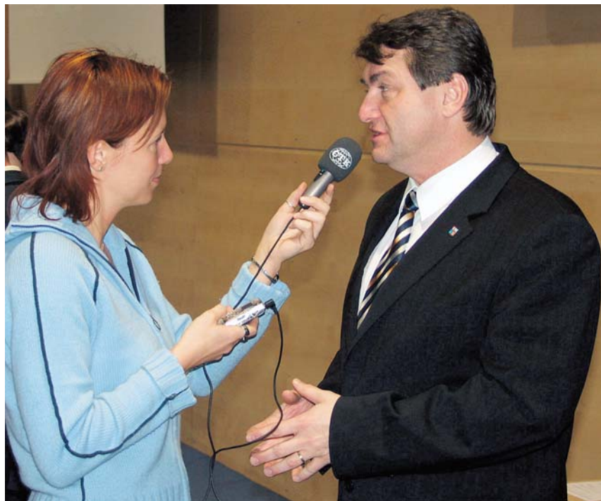
Jiří Šulc – první rozhovor s novináři ve staronové funkci hejtmána