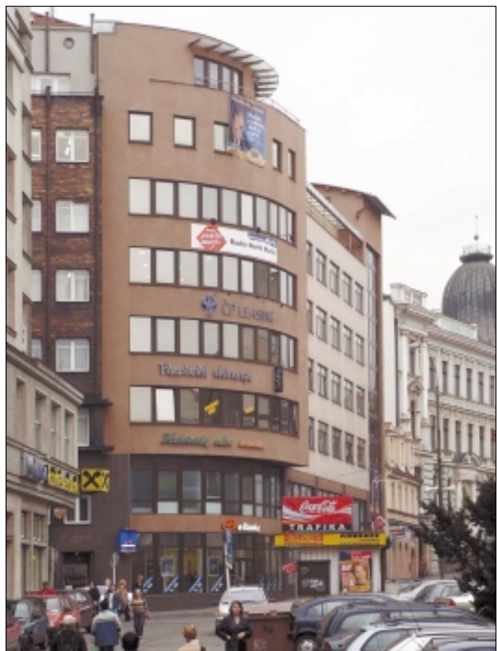
Dům na křižovatce ulic Pařížská a Velká Hradební v Ústí nad Labem, držitel titulu Stavba roku 2004

Pravidelně chceme hodnotit plnění Dlouhodobého záměru vzdělávání a rozvoje výchovné vzdělávací soustavy školství v Ústeckém kraji, dopracovat a realizovat institut krajského stipendia.