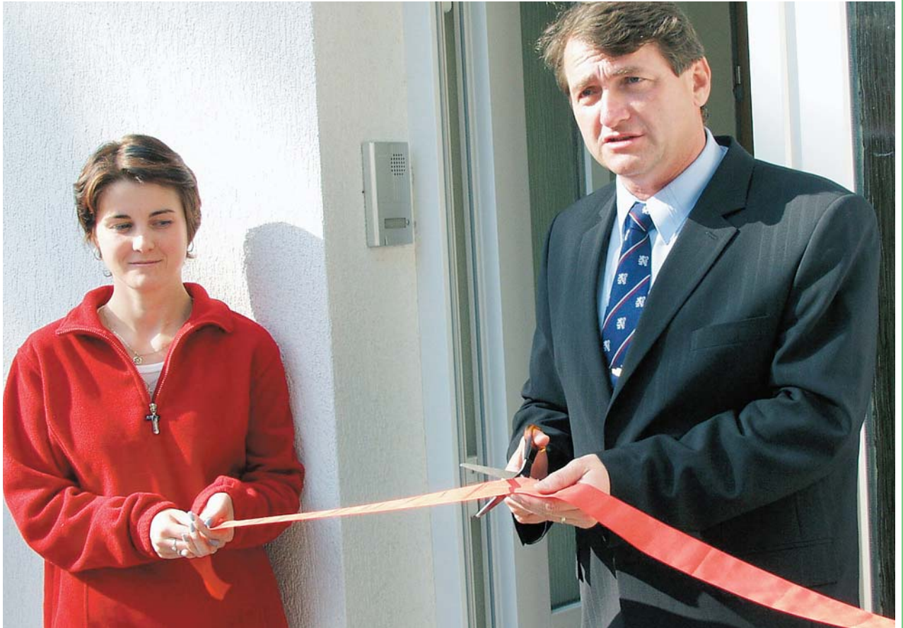
Na Lounsku vyjíždí záchranka k pacientům z nového objektu - rekonstruované oblastní středisko bylo poté, co hejtmán Jiří Šulc přestříhl pásku, předáno občanům do užívání po rozsáhlé opravě a přestavbě objektu. Celkové náklady dosáhly 7 milionů korun, provozní jednotka zdravotnické záchrané služby v Lounech ale dnes splňuje základní standardy pro naplnění podmínek dostupnosti a poskytování přednemocniční neodkladné péče.