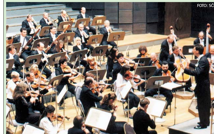
Ústecký kraj ze svého rozpočtu podpořil aktivity významných kulturních zařízení. Město Ústí nad Labem tak od kraje získá 5,9 milionu korun pro ústecké Městské divadlo a Činoherní studio. Peníze budou použity například k rozšíření regionálního působení divadla, k výměně představení s mosteckým divadlem a k posílení stávajícího hostování divadla v regionu. Také v případě Činoherního studia bude dotace použita k posílení regionálního působení souboru a k podpoře projektu Autorská dílna. Dotaci získá i Most pro své městské divadlo. 4,6 milionu korun by měly divadlu pomoci rozšířit regionální působení divadla a loutkové scény Divadla rozmanitost. Kraj se rozhodl podpořit i Severočeskou filharmonii Teplice. Ta dostane 2,5 milionu korun které budou mimo jiné použity i pro zajištění výchovných koncertů pro školní děti a mládež. Celkem kraj takto rozdělil 13 milionů korun.