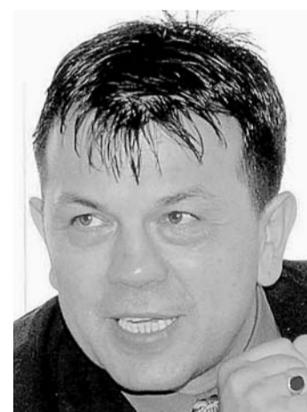
Například nám bylo podšouváno, že obcím tyto příspěvky nařizujeme. Rád bych představitele obcí, kterým se navržený princip solidarity s os-

Jedním z ostře sledovaných témat v našem regionu je zajištění základní a ostatní dopravní obslužnosti v Ústeckém kraji v příštím roce. Je bohužel smutnou realitou, že většinu autobusových i vlakových spojů provozují dopravní společnosti se ztrátou na tržbách, kdy rozdíl hradí u spojů v základní dopravní obslužnosti prostřednictvím krajů stát a u ostatní obslužnosti obce. Pro rok 2004 jsme navrhli obcím hrazení těchto ztrát tak, aby samosprávy zaplatily za každého svého obyvatele 150 korun ročně. Přibližně sedmdesát procent obcí ale v polemice tento způsob společného hrazení ztrát zcela legitimně odmítlo. V rámci jakési pseudodiskuse kterou jsem sledoval v tisku, jsem si bohužel přičetl i řadu nepravdivých torzen.