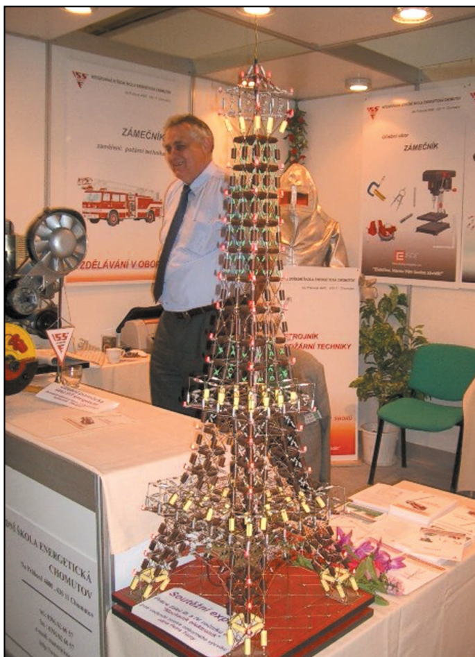
Svou práci na výstavě představila i Integrovaná střední škola energetická Chomutov.

Školy z Ústeckého kraje získaly první místa v následujících kategoriích: