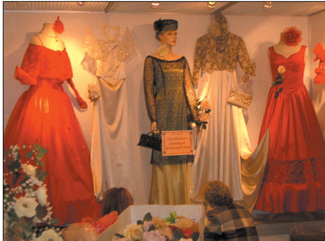
Střední odborná škola z Varnsdorfu na výstavě představila kolekci společenských šatů.

Školy z Ústeckého kraje zvítězily ve čtyřech kategoriích a v jedné obsadily třetí místo.