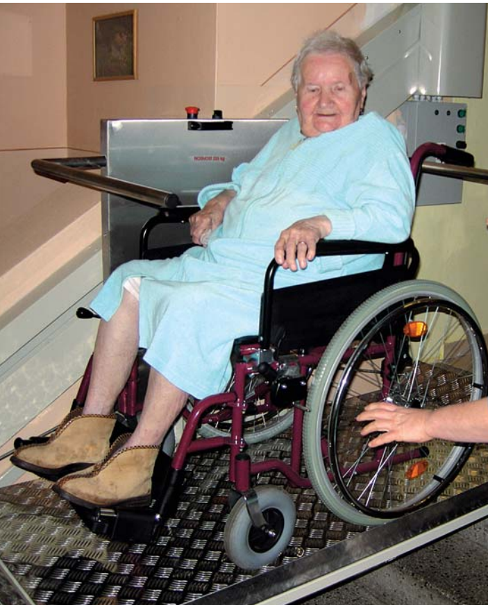
Na ilustračním fotu je pohled do Domova důchodců v Teplicích, kde mají klienti novou plošinu pro vozíčkáře. Ústecký kraj ji pořídil pro tuto svoji příspěvkovou organizaci ze svého rozpočtu.

závislostí,“ konstatoval Petr Fiala. V mosteckém kojeneckém ústavu také vyzdvihl činnost „Zařízení pro děti vyžadující okamžitou pomoc“. Jde o péči, v jejímž rámci je poskytována ochrana a pomoc dítěti, které se ocitlo bez jakékoliv péče, v ohrožení života, je vystavené například tělesnému nebo duševnímu týrání anebo se ocitlo v prostředí nebo situaci, kdy jsou závažným způsobem ohrožena jeho základní práva. Tento typ péče je prvním druhem v Ústeckém kraji.