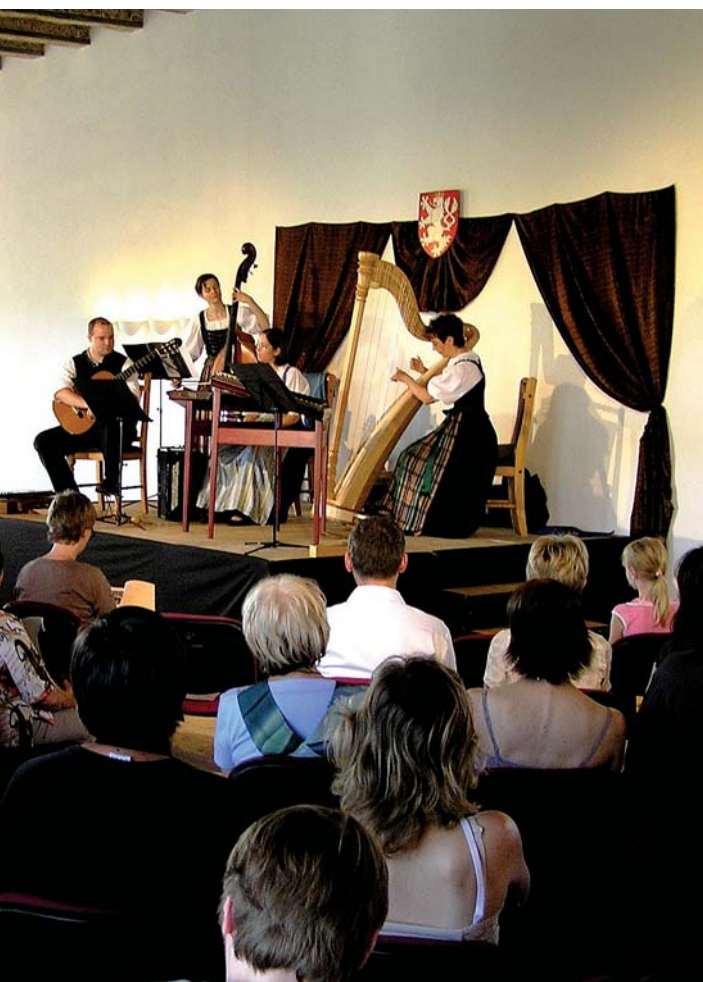
Na snímku: Bavorské kvarteto Ostrachtaler Saitenmusik, které vystoupilo 29. června 2008 na zámku Nový Hrad v Jimlíně v rámci XVII. ročníku Festivalu Mitte Europa. Celý festival podpořil Ústecký kraj částkou 300 tis. Kč v rámci Programu podpory regionální kulturní činnosti na rok 2008.

Krajští úřad Ústeckého kraje, Odbor kultury a památkové péče, vyhláší na rok 2009 tyto dotační programy: