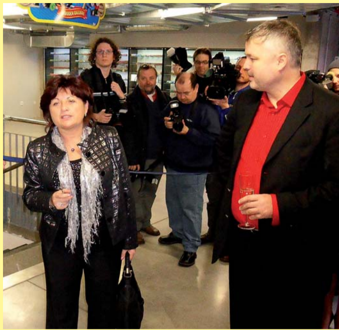
Nejvyšší představitelka Ústeckého kraje za chvíli uvede slavnostně do provozu model železnice našeho regionu

Praha - V expozici Království Železnic v Praze na Smíchově (stanice Anděl na metru „C“, Stroupežnického ul. 23), byl 14. ledna zpřístupněn model Ústeckého kraje s kolejemi, vláčky, nádražími a řadou dominant regionu na severu Čech. Železniční model kraje, který do provozu slavnostně uvedla hejtmanka Jana Vaňhová, má 121 metrů kolejí, desítky rychlíků a nákladních vlaků, stovky postavíček, nepočítané stromů, ale také stovky návštěvníků, lamp a 139 nejvýznamnějších staveb. Najdete tu nádraží mimo jiné v Ústí, Mostě a v Děčíně, povrchový lom u Bíliny, horu Říp v měřítku 1:220, hrad Střekov, autodrom v Mostě nebo třeba velkobřezenský pivovar a další významné výrobní areály. Našemu kraji patří v Království Železnic prvenství, zbývající modely regionů ČR přijdou na řadu v příštích třech letech a tak k 54 m 2 Ústeckého kraje přibude dalších téměř tisíc čtverečních metrů (do letošního května ještě kraje Karlovarský a Plzeňský) a atrakce v centru Anděl City bude srovnatelná s dalšími podobnými expozicemi v Evropě. Součástí Krá-