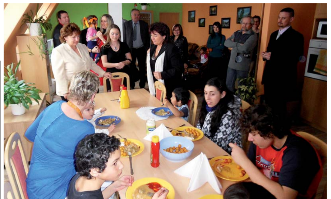
V jednom ze čtyř samostatných „bytů“ byla právě doba oběda