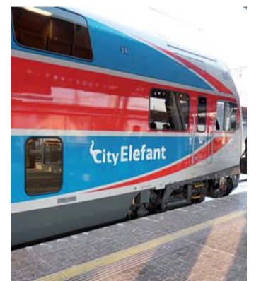
Moderní souprava CityElefant na hlavním nádraží ČD v Ústí nad Labem, kam zajiždějí zatím jen soupravy z Prahy...

Odbor dopravy a silničního hospodářství Ústeckého kraje prezentoval a předal komplexní materiál shrnující nejpálčivější nedostatky železniční infrastruktury v kraji, které brzdí železnici nejen v rychlosti jízdy, ale i v kvalitativním vnímání prostředí stanic a bezpečnos-