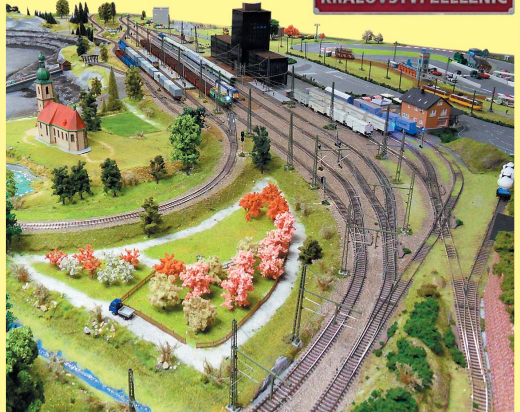
Alespoň část obřího modelu; zcela vpravo mostecký autodrom, před ním výšková budova vlakového nádraží v Mostě

niční modeláři v uplynulých měsících více než 18 000 hodin. Podívejte se na pražský Smíchov, výstava rozhodně stojí za zhlédnutí! (www.kralovstvi-zeleznic.cz)