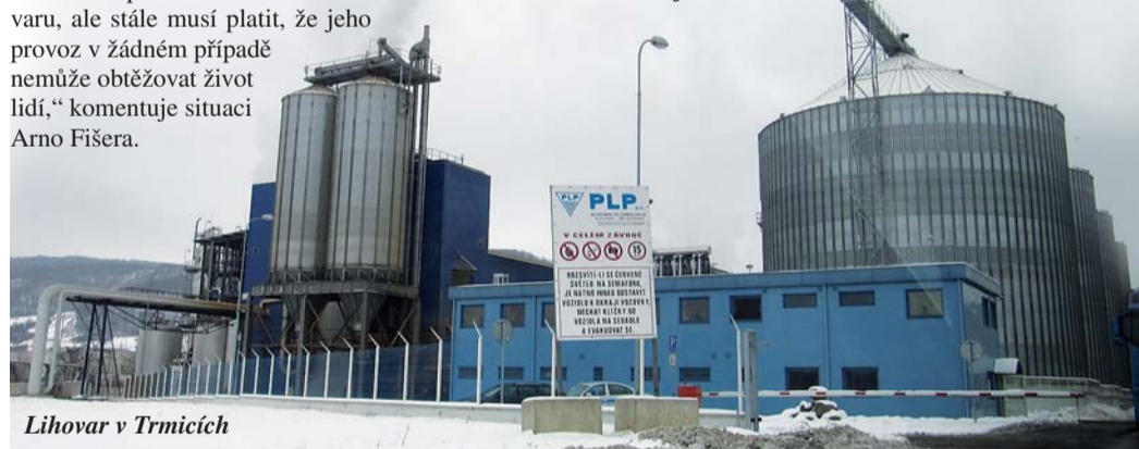
Lihovar v Trmicích