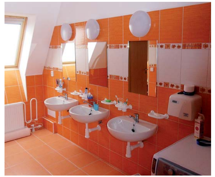
V domově jsou nyní také takovéto nádherné umývárny