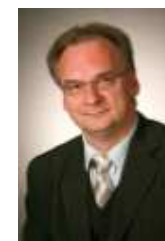
Dr. Reiner Haseloff, Minister of Economy and Labour of Saxony-Anhalt and President of the ECRN e.V.

Svaz chemického průmyslu České republiky Association of Chemical Industry of the Czech Republic