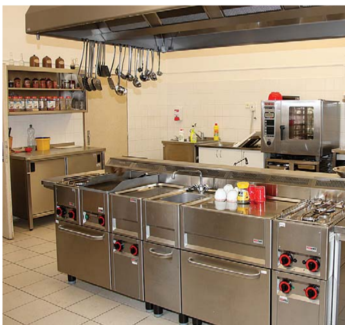
Krásná „vývařovna“, tedy praktická učebna, už čeká na žáky gastronomických oborů

Úspěch roudnických fotbalistů Vyšší odborná škola a Střední odborná škola Roudnice nad Labem, která je příspěvkovou organizací Ústeckého kraje, si na své konto připsala sportovní úspěch. Ve fotbalové sezóně 2011/2012 budou její žáci do 19 let hrát druhou nejvyšší soutěž v ČR, a to Národní ligu, chlapci ve věku do 16 a 17 let budou bojovat dokonce v nejvyšších soutěžích.