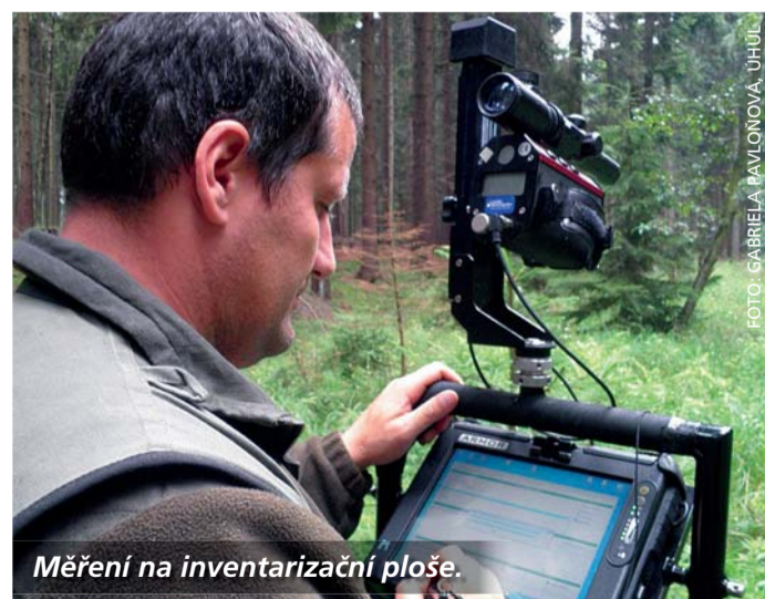
Měření na inventarizační ploše.

„Inventarizaci lesů získáváme údaje, zejména o zásobách dřeva, dřevinné skladbě, zdravotním stavu a funkcích lesů.