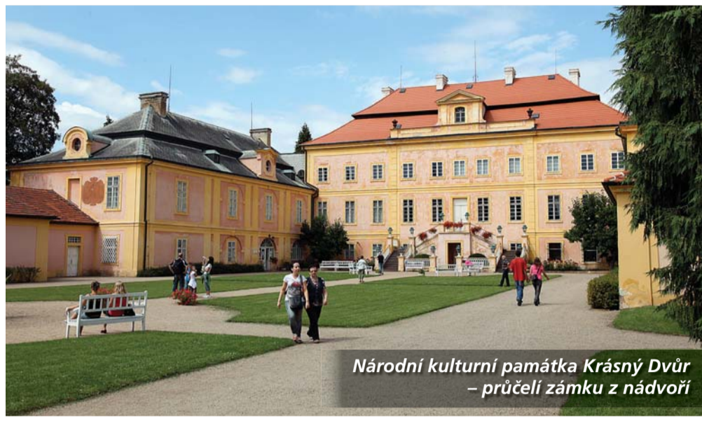
Národní kulturní památka Krásný Dvůr – průčelí zámku z nádvoří

Unikátní zámek s ohromným zámeckým parkem je častým cílem milovníků historie. Druhou srpnovou sobotu přijely do Krásného Dvora stovky turistů, někteří kvůli zámku, většina z nich na tradiční akci – Romantický sen 19. století. Po procházce téměř stohektarovým parkem v anglickém stylu, který byl zbudován v letech 1783 - 1793, prohlídce jeho