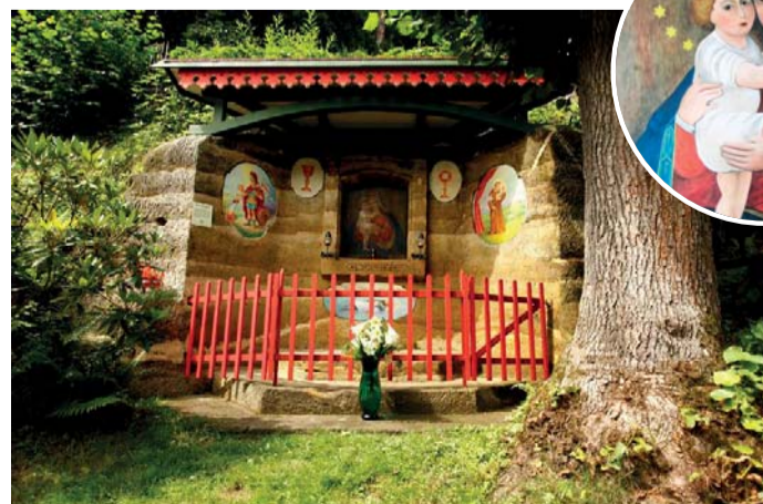
Johnova kaple po rekonstrukci. Ve výřezu replika obrazu Panny Marie Pomocné na snímku H. Bělinové.

Občanské sdružení pod Studencem (OspS) oznámilo definitivní dokončení rekonstrukce Johnovy kaple z r. 1760 ve Studeném. Stalo se tak po instalaci repliky centrálního obrazu Panny Marie Pomocné, jehož originál byl obnoven a darován Oblastnímu muzeu Děčín v minulém roce. Kaple je jednou z mnoha obnovených drobných kulturních památek v oblasti Českého Švýcarska, kterou provedlo Občanské sdružení pod Studencem. Restaurátorka Hana Bělinová přivezla a instalovala repliku deskového