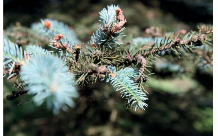
Na smrku pichlavém je světlé jehličí zdravé, ostatní je napadeno houbou kloubnatkou smrkovou.

V nadmořské výšce kolem 850 metrů si vedení kraje a odborníci prohlédli závažnost poškození smrku pichlavého. Kromě