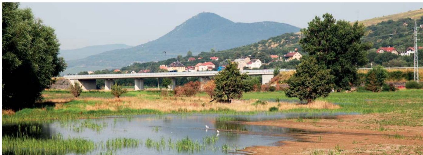
Z ohromné mnohakilometrové laguny u Mlékojed už díky zásahům hasičů a opravou letního počasí zbývalo v době naší návštěvy (polovina července) už jenom pár menších jezírek. V pozadí je dálniční přivaděč Prosmky k mostu gen. Chábery a úplně na horizontu Lovos.