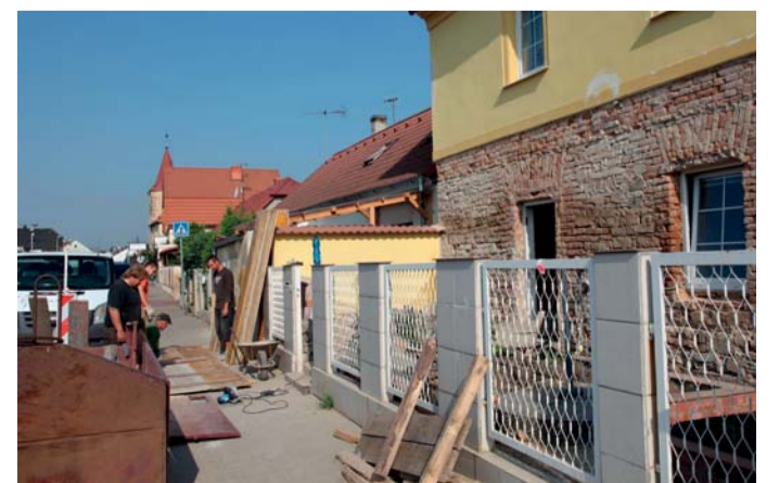
Zgruntu vzal rekonstrukci tohoto domu poškozeného povodní jeho majitel. Opravu provádějí zaměstnanci lovosické firmy Raeder & Falge, s.r.o.