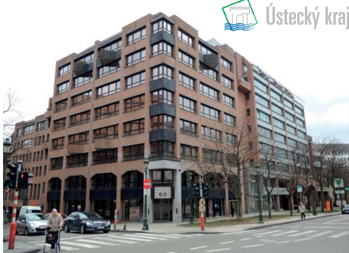
V pátém podlaží „Českého domu“ na adrese 60 Rue du Trône má Ústecký kraj v Bruselu své zastoupení.