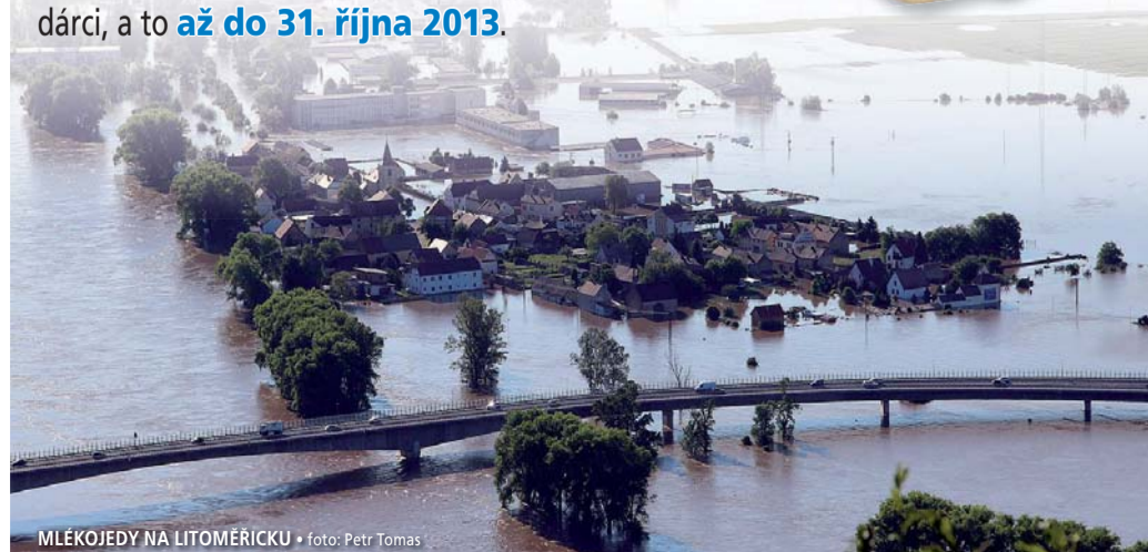
MLEKŮJEDY NA LITOMĚŘICKU