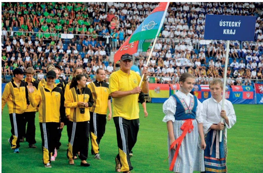
Vlajkonošem výpravy sportovců Ústeckého kraje byl v Uherském Hradišti bývalý olympionik – veslař Zdeněk Pecka. Na LOH 1976 a 1980 získal po jedné bronzové medaili.

Od 23. do 28. června, tedy úplně na konci školního roku, se ve Zlínském kraji uskutečnily již VI. Hry letní olympiády dětí a mládeže ČR. Bylo na nich 2 550 mladých sportovců, 505 trenérů a řada významných