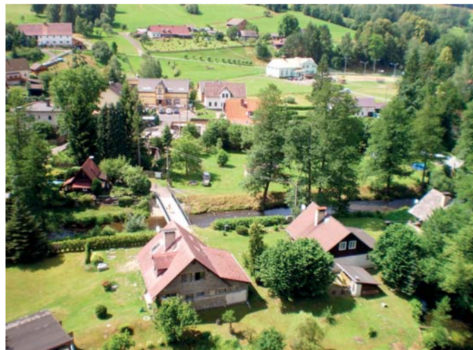
Alespoň částečný pohled na letní Srbskou Kamenici.

Cílem soutěže Vesnice roku je snaha vyzdvihnout aktivity obcí, jejich představitelů a občanů, kteří se snaží nejen zvelebovat svůj domov, ale rozvíjejí i místní tradice a zapojují se do společenského života v obci. Soutěž má také upozornit širokou veřejnost na význam venkova. Vyhlásovateli soutěže jsou spolu s Ústeckým