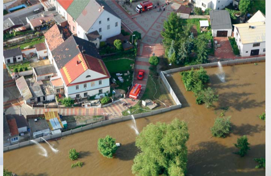
V Pišánech protipovodňová hráz perfektně obec před povodní ochránila. V roce 2002 byla obec ještě celá pod vodou...

Když se projektovala protipovodňová opatření po ničivé povodni v roce 2002, určitě málokdo předpokládal, že za 11 let se potkáme opět se stoletou vodou. Opatření proti velké vodě byla projektována a postavena v dostatečném rozsahu, příroda předpoklady poněkud překonala. Odborníci musí posoudit, zda a jakým způsobem lze současná protipovodňová opatření vylepšit či doplnit o další stavby.