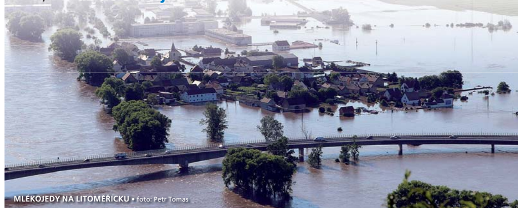
MLÉKOJEDY NA LITOMĚŘICKU