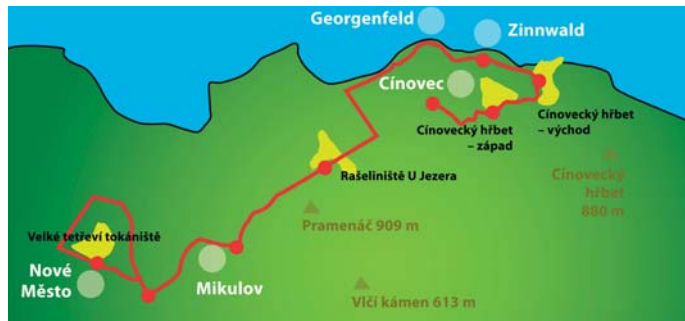
Mapka rašeliníšť v Krušných Horách zařazených do projektu Blíž k přírodě.

projektem NET4GAS a společnosti Daphne a zapojeny jsou do něj i o.s. Ametyst a Ústecký kraj. Obnova původních rašeliníšť je součástí širokého projektu spol. NET4GAS Blíž k přírodě.