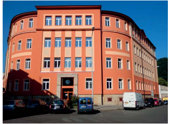
Hlavní budova školy je po rekonstrukci jak nová.