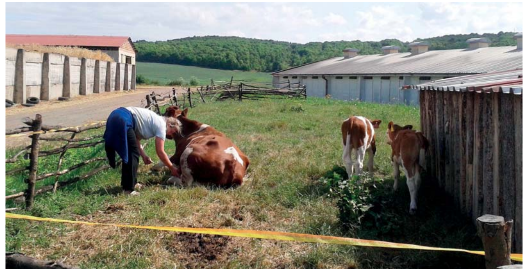
Na statku se starají také o desítky kusů hovězího dobytka.

A to je právě jeden z největších problémů - žákům chybí při praktikování a při potřebném zapracování odborníci