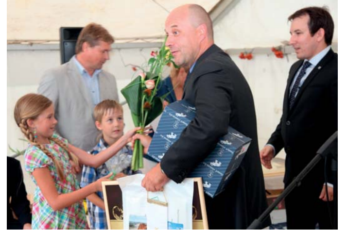
Městys Cítoliba na Lounsku má za práci s mládeží Bílou stuhu.