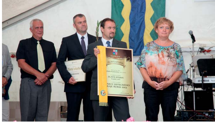
Zlatou stuhu v letošním ročníku Vesnice roku 2013 Ústeckého kraje (celostátně probíhá tato soutěž již od roku 1995) získala Srbská Kamenice.

Zlatá stuha (absolutní vítěz): Srbská Kamenice , okres Děčín, Modrá stuha (za péči o společenský život v obci): Vědomice , o. Litoměřice, Bílá stuha (za činnost mládeže): Cítoliba , o. Louny, Zelená stuha (za péči o zelesňování a životní prostředí): Nové Sedlo , o. Louny, Oranžová stuha (za spolupráci obce a zemědělského subjektu): Bělušice , o. Most. Udělena byla i Cena naděje (Dušníky) , diplomy a mimořádná ocenění včetně „zlatých cihel“ a Cena Objev roku (Lkáň) .