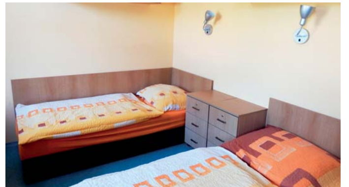
Pokoje v Domově mládeže jsou již připraveny pro žáky z nejrůznějších koutů ČR.