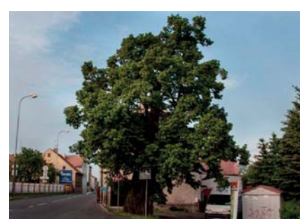
Lípa v Krupce - Unčíně.

Unčínská 300 let stará lípa malolistá (tilia cordata), stojící u frekventované silnice ve směru na Ústí nad Labem, byla v celostátní anketě Strom roku 2013 vybrána odbornou komisí mezi 12 finalistů. Anketu organizuje každoročně Nadace Partnerství. Letitou, ale zároveň velmi vitální lípu nominovalo do ankety občanské sdružení Zdraví pro