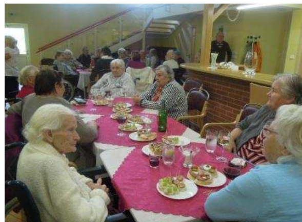
Zábava DpS Šluknov