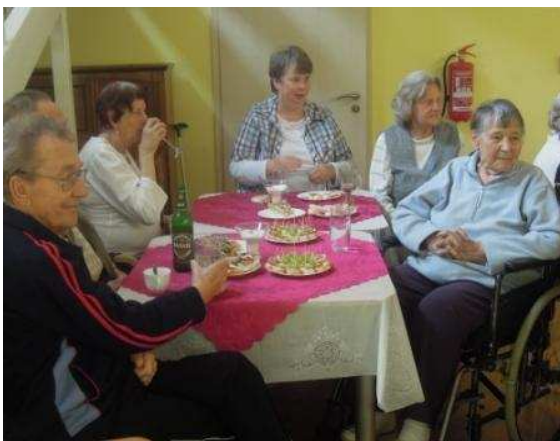
Zábava DpS Šluknov