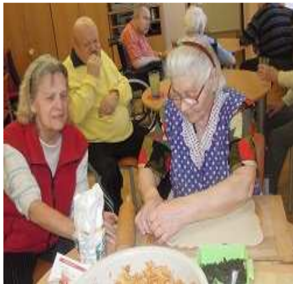
Vaření DpS Šluknov