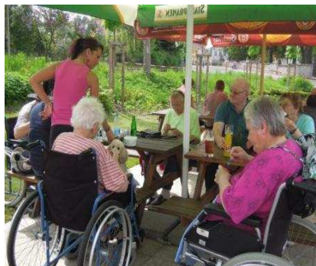
Návštěva restaurace ve Šluknově