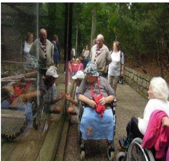
Výlet do ZOO Liberec