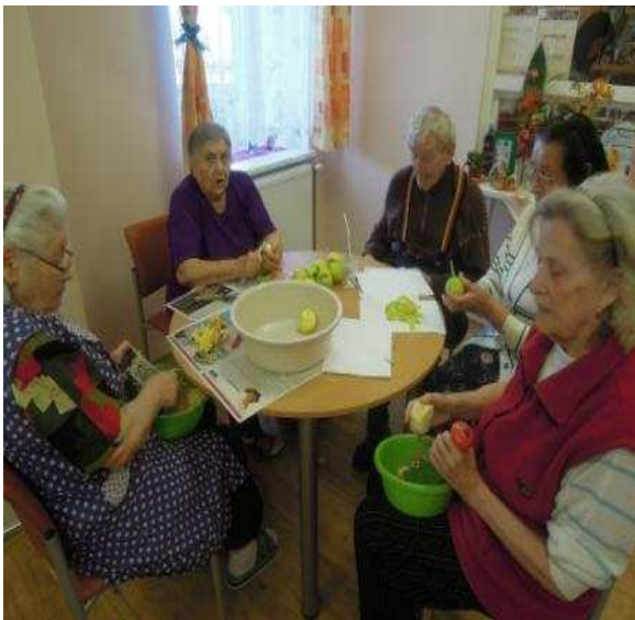
Vaření DpS Šluknov