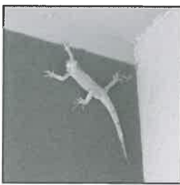
Leguán ve výklenku paneláku v Hornické ulici, vpravo již v bezpečí u strážníka.