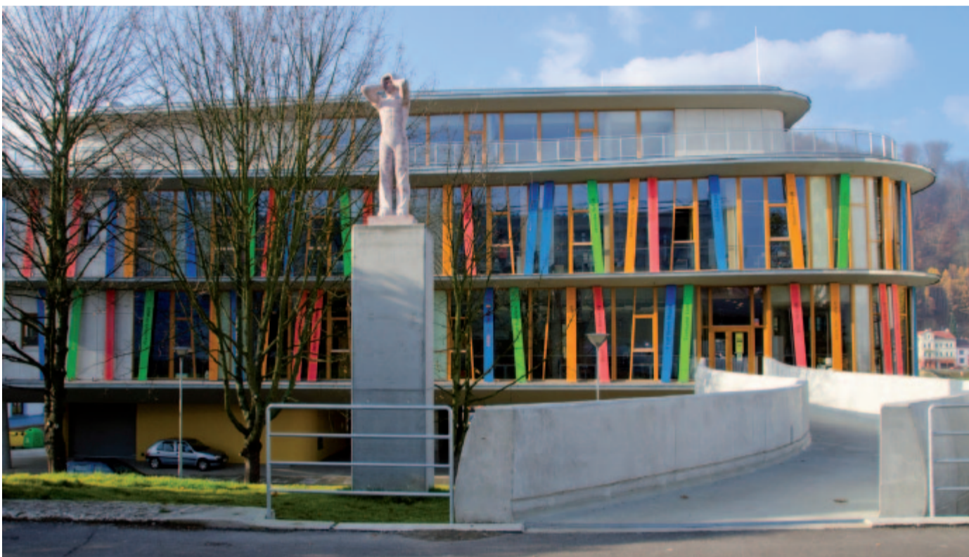
Děčínská knihovna nenabízí jen klasické výpůjčky knih, ale také bohatý kulturní program.

Prostředky ale směřovaly také do Chodova, kde s podporou ROP Severozápad