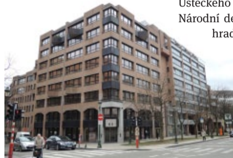
60 Rue du Trône – dům se zázemím pro Zastoupení Ústeckého kraje v Bruselu.