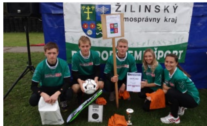
Páté místo si přivezli ze Žiliny studenti chomutovského gymnázia.

V rámci uzavřené Dohody o spolupráci mezi Žilinským samosprávným krajem a Ústeckým krajem se žáci Gymnázia Chomutov, krajské příspěvkové organizace, zúčastnili vědomostně-sportovní soutěže Župná kalokagatia 2013. Chomutovský tým skončil pátý