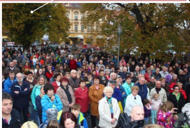
Slavnostní atmosféra na litoměřickém hradu při oceňování našich záchranářů medailemi a diplomy.