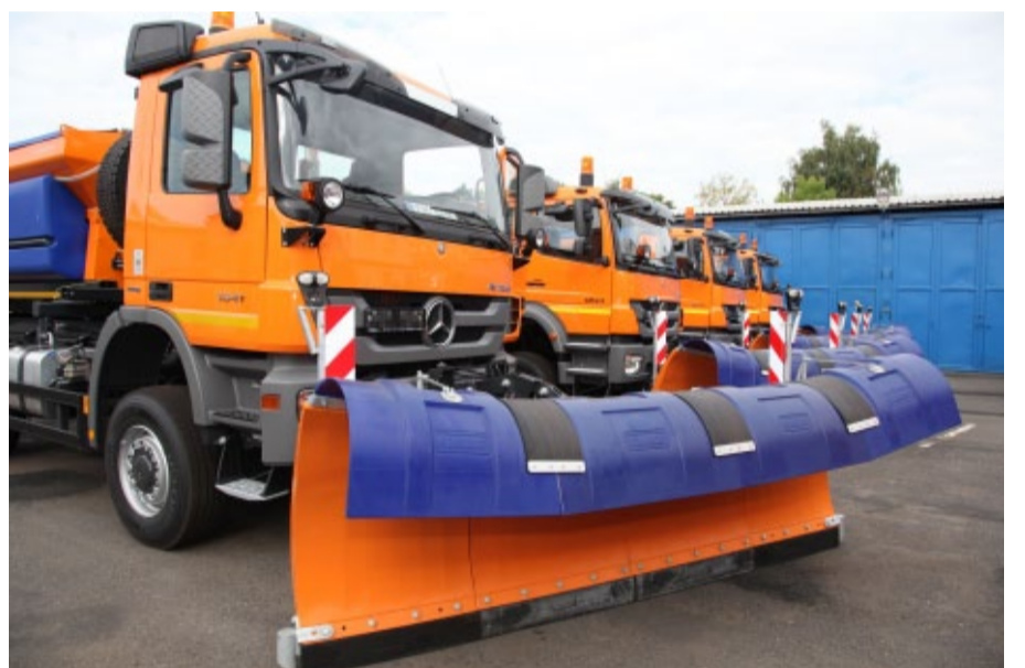
Deset nových nákladních vozidel – sypačů dostala SÚS vloni a stejný počet i letos. Nové vozy za 60 milionů korun převzali krajští silničáři letos v srpnu.

Náklady na zimní údržbu silnic v sezóně 2012/2013 přišly na téměř 180 milionů korun.