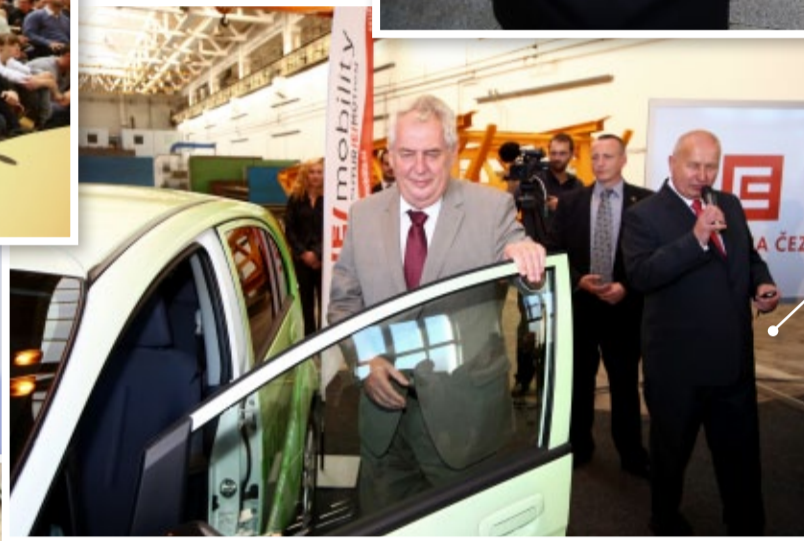
Prezident byl v Bilině u předání elektromobilu do užívání Ústeckým krajem. Jde o dar společnosti ČEZ.