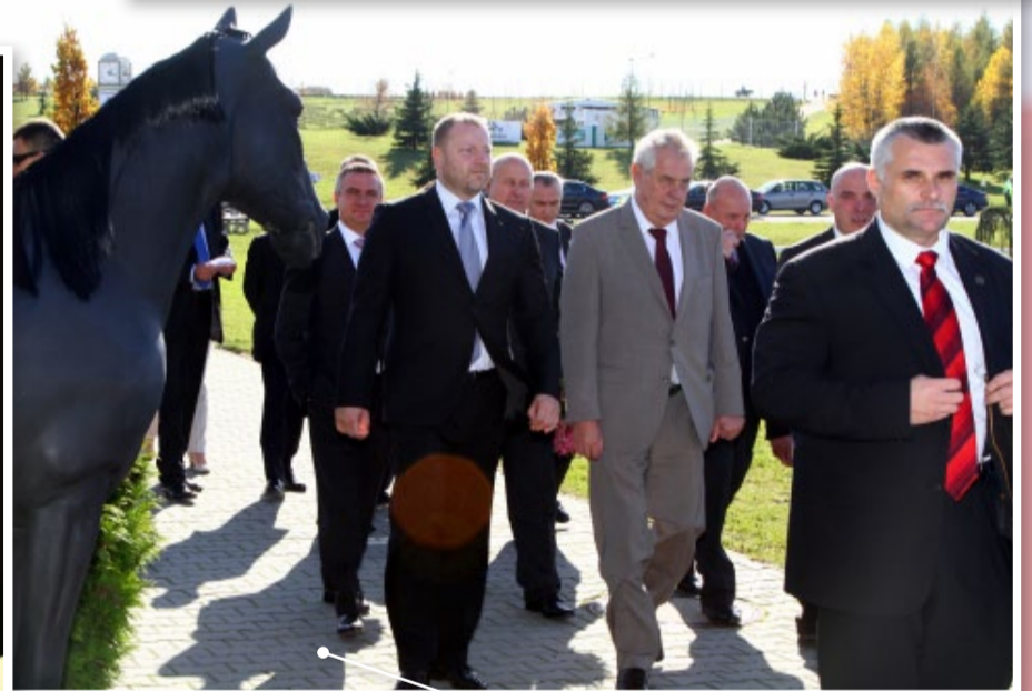
Mostecký hipodrom ocenil prezident jako zdařilou ukázkou kvalitní rekultivace po těžbě uhlí.