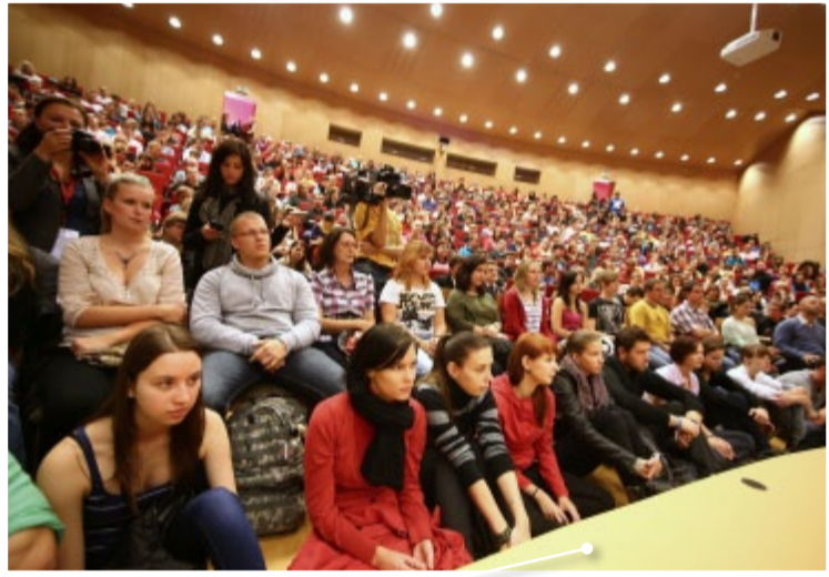
Nabitá aula Univerzity J. E. Purkyně v krajské městě, respektive v univerzitním kampusu.