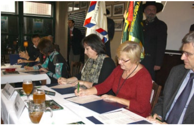
Žatec, také Ústecký kraj, který při podpisu zastoupila

Ve čtvrtek 14. listopadu bylo v Chrámě chmele a piva v Žatci podepsáno Společné memorandum o spolupráci při přípravě statku Památky pěstování a zpracování chmele a výroby piva v Žatci k podání nominační žádosti na zápis na Seznam světového dědictví UNESCO. Mezi signatáři memoranda je mimo iniciujícího města Žatce, Ministerstva kultury ČR, Národního památkového ústavu, Chmelařského družstva Žatec a Chmelobraný