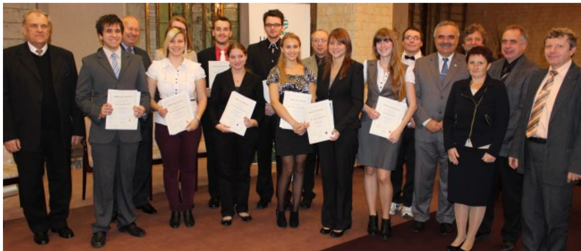
Noví držitelé Dobrých listů s představiteli organizátorů akce, kraje, města a OHK Most.

„Absolventům vysokých škol v Ústeckém kraji, a to nejen těm nejlepším a dnes oceněným, bych chtěl popřát, aby získali odpovídající zaměstnání ve své profesi, aby nabyté vědomosti dokázali uplatnit v praktickém životě a prodali u svých zaměstnavatelů a aby i jejich práce byla adekvátně finančně oceněna,“ řekl též hejtmán.