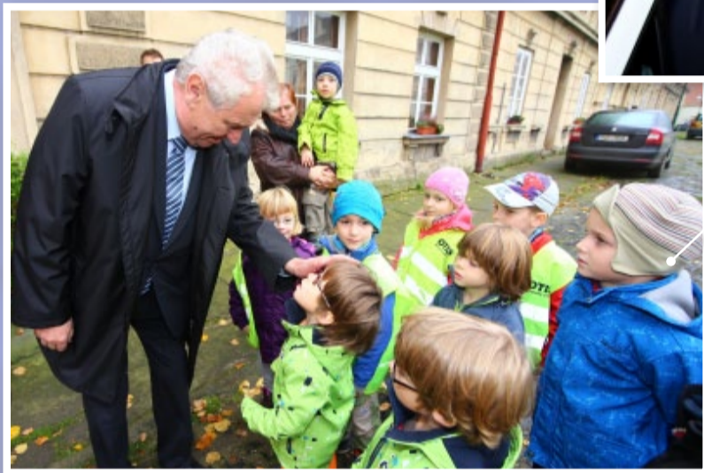
Neplánové, o to milejší, bylo páteční setkání Miloše Zemana s předškoláčky v Litoměřicích.