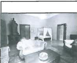
Zámecký pokoj.

Vzpomenete si na nějaký příklad? Vzpomínám si na svatbu v historic-