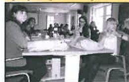
Zahraniční hosté zhlédli prezentaci jirkovských školek a škol.

Tři dny strávili v Jirkově hosté z Anglie a Itálie. Jejich pobyt byl ve znamení rozvíjení spolupráce v rámci projektu EMPAC, do něhož jsou zapojeny dvě mateřské školy a jedna základní (MŠ Smetanovy sady, Nerudova a ZŠ Nerudova).