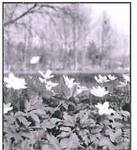
Nemocné stromy budou pokáceny, přibude 309 listnatých a 3 681 keří a trvalek.