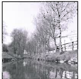
Zelená tvář parku dozná výrazné proměny.

V Olejomlýnském parku se až do poloviny 20. století pěstovalo ovoce. Energit řeky využívala olejna (Olejový mlýn). V 19. až 20. století zde fungovala Pádelna, která později vyhořela. Dopravní hřiště bylo vybudováno v druhé polovině minulého století.