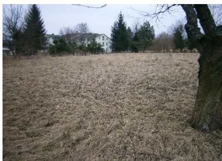
Pozemek Velký Šenov