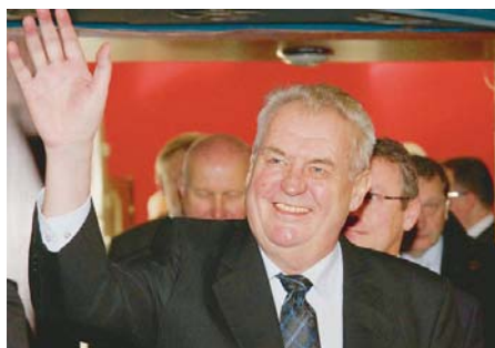
PREZIDENT ČR MILOŠ ZEMAN