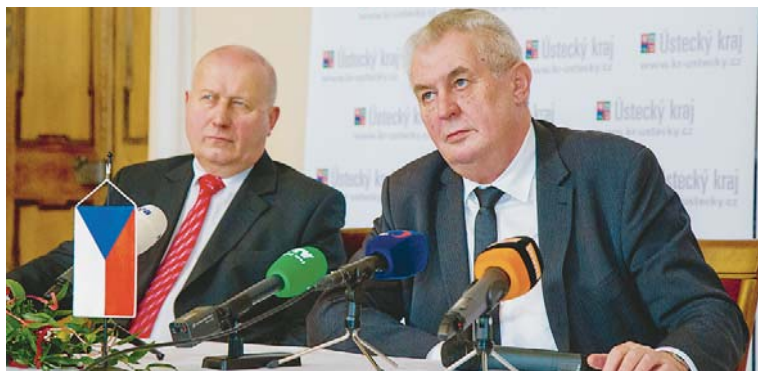
ZÁVĚR NÁVŠTĚVY Miloše Zemana, kterého po celou dobu doprovázela manželka, patřil odpovědím novinářům na tiskové konferenci. Uskutečnila se v prostorách zámku Červený Hrádek u Jirkova.