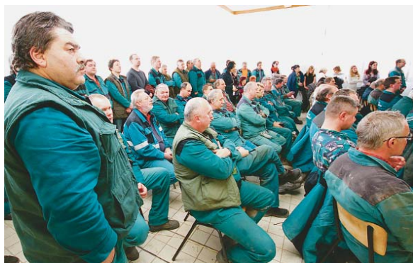
HORNÍCI ze společnosti Severní energetické ocenili postoj prezidenta k nutnosti prolomení těžebních limitů.