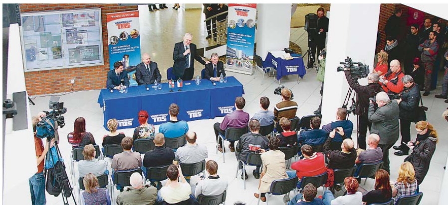
ÚPLNĚ NA SEVERU KRAJE, ve Varnsdorfu, besedoval prezident s dělníky, techniky a členy vedení firmy TOS Varnsdorf, světově známého výrobce obráběcích strojů.