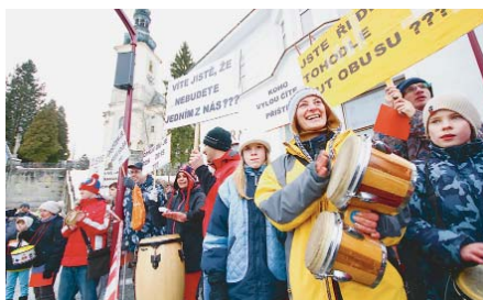
NEPLÁNOVANĚ se pan prezident sešel v Krásné Lípě s několika handicapovanými občany, kteří protestovali proti jeho nedávným názorům na nevhodnost společného vzdělávání handicapovaných a zdravých dětí. Prezident znovu vysvětlil, že inkluzi chápe tak, že učitelé mají na zdravotně postižené děti v praktických třídách daleko více času, a rozhodně tím nevyjímá handicapované občany z naší společnosti.