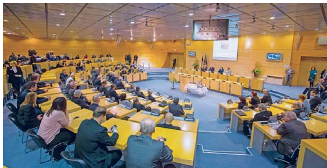
PO UVITÁNÍ PŘED HEJTMANSTVÍM prezident besedoval v konferenčním sálu se zastupiteli a dalšími pozvanými.