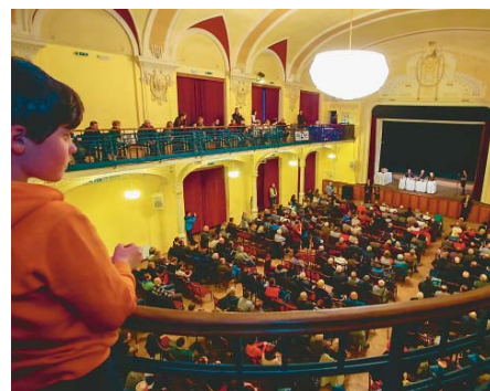
O BESEDU A DISKUZI s prezidentem byl i ve velkém sálu děčínské Střelnice velký zájem.