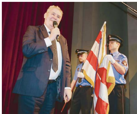
TAKÉ V ÚSTÍ NAD LABEM přijal Miloš Zeman prezidentskou stuhu na městský prapor.