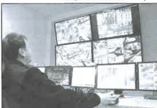
Díky kamerám bylo při činu chyceno 71 pachatelů.

Černé uniformy znají obyvatelé Jirkova od vidění, strážníci a jejich tři kolegyně kontrolují město při pěších pochůzkách i ve služebních autech, ve dne i v noci. Pomáhá jim ještě šest žen, placených úřadem práce, zaměstnaných v rámci veřejně prospěšných prací jako dozor veřejného pořádku. Jejich úkolem je ráno a odpoledne dohlížet kolem základních škol na děti a jejich bezpečí, obhlížejí město při pochůzkách podle potřeby a rozmístě-