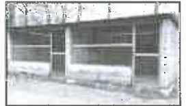
Nové kotce pro psy.

Do jirkovského psiho útulku investovalo loni město přes dvě stě tisíc korun. Nechal opravit a vyměnit střešní krytinu, která byla v havarijním stavu, vyměnit elektrické zabezpečovací zařízení a zaplatilo zednické práce na dvou kotečích.