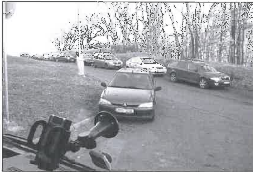
Pohled z kabiny hasičského mercedesu na křižovatku v Krušnohorské ulici, sjezd u restaurace Koliba. Tentokrát projeli, ale přes zákaz vjezdu. Auto stojí tam, kde nemají.