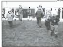
Hrátky na zahradě největší ze školek - ve Smetanových sadech.

přednost předškoláci. Dále jsou přijímány ty, které dosáhnou tří let věku do 31. srpna 2015. Pokud budou i poté ještě volná místa, mohou být přijaty mladší. Stejně tomu bylo v posledních letech, Jirkov má totiž v mateřinkách dosta-