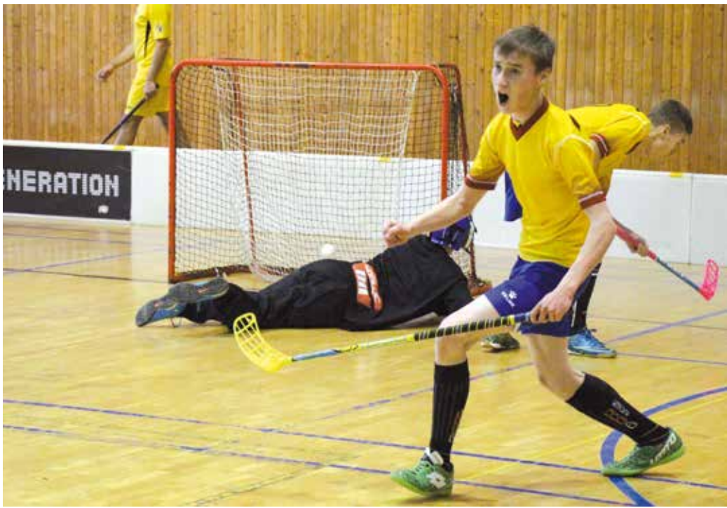
VÍTĚZOVÉ TURNAJE se stali kluci z Plzně.

Finálový soubor nakonec po dramatickém průběhu vyhrál Dětský domov Domino Plzeň. Druzí skončil nováček turnaje DD Jablonec nad Nisou a bronz brali kluci z Hostouně.