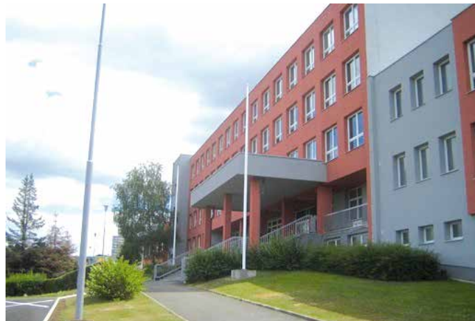
TAKTO VYPADÁ mostecká škola po rekonstrukci.

Účelem této modernizace bylo snížení energetické náročnosti dotčených budov a jejich kvalitnější zabezpečení.