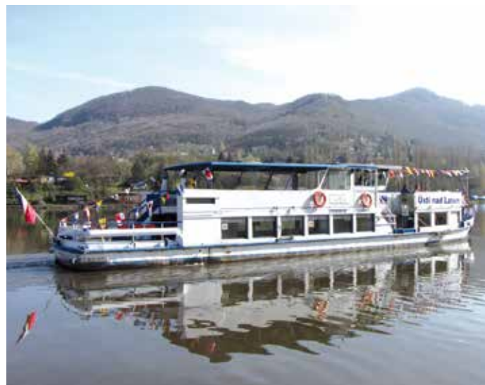
LABE BRÁZDÍ PRVNÍ LODÍ v systému veřejné osobní dopravy DÚK.

Pokud se vydáte na cestu pouze lodí, jednosměrné jízdné se na trase mezi Ústím a Litoměřicemi pohybuje pro dospělé od 18 do 38 korun a pro děti od 9 do 19 korun. V zóně 101 z přístaviště Ústí nad Labem centrum do přístaviště ve Vaňově navíc můžete v rámci integrace kromě jízdenek DÚK využít i platnou časovou legitimaci nebo jednorázové jízdenky MHD Ústí nad Labem. Důchodci nad 70 let mohou tuto trasu díky sjednané výjimce pro zónu 101 využít stejně jako jinou veřejnou dopravu zdarma.