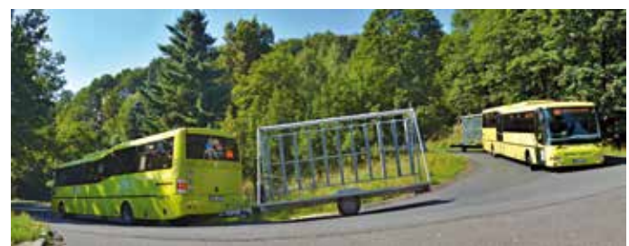
CYKLOBUSY NA KOMÁŘÍ VÍŽKU vyvezou cyklisty i s koly a dolů jedou prázdné.

Cena přepravy jízdních kol dle tarifu DÚK zůstává na stejné úrovni jako loni – jednorázová nepřestupní jízdenka pro jízdní kolo stojí 20 korun a platí na území Ústeckého kraje.