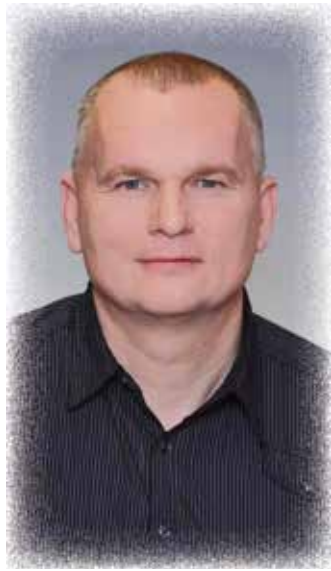
Bronislav Schwarz (Severočeskí.cz), krajský zastupitel a poslanec Parlamentu ČR

Proto se na Vás obracíme s následující otázkou: Myslíte si, že má podpora akcím projektu „Rodinné stříbro“ ze strany kraje význam? Navštívil(a) jste někdy některou z těchto akcí? Kterou byste doporučil(a) k návštěvě a proč?