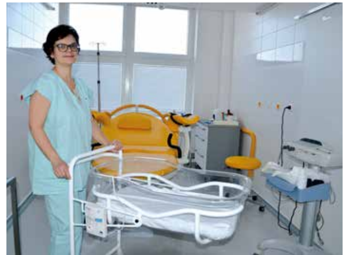
ODDĚLENÍ MOSTECKÉ PORODNICE prokouklo.