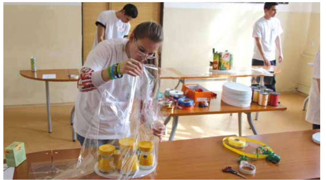
Žáci se musí popasovat i s aranžováním dárkových košů.