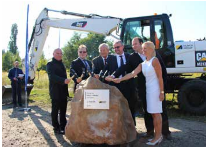
SLAVNOSTNÍ POKLEP na základní kámen proběhl, staveniště je předáno, stavba začíná.

Hlavní trasa nové výstavby bude v délce 1 877 metrů s plochou vozovky téměř 38 tisíc m 2 a počtem stavebních objektů 113. Její cena bez DPH dosahuje 474 milionů korun a ukončena by měla být za 18 měsíců.