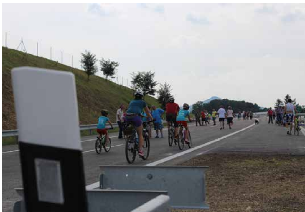
PO TĚTO RYCHLOSTNÍ KOMUNIKACI by měli řidiči ještě letos jezdit.

Řada návštěvníků se podle jejich slov přišla přesvědčit, že stavba pokračuje podle harmonogramu, aby byl dodržen termín otevření 17. prosince. „Je dobré, že se mohou lidé přímo na místě podívat, co dalšího se podařilo dokončit. Pan ministr zde znovu přislíbil, že v prosinci už budeme po dálnici jezdit. Bude to velký vánoční dárek nejen pro řidiče, ale hlavně pro obyvatele z obcí, kudy dnes ve-