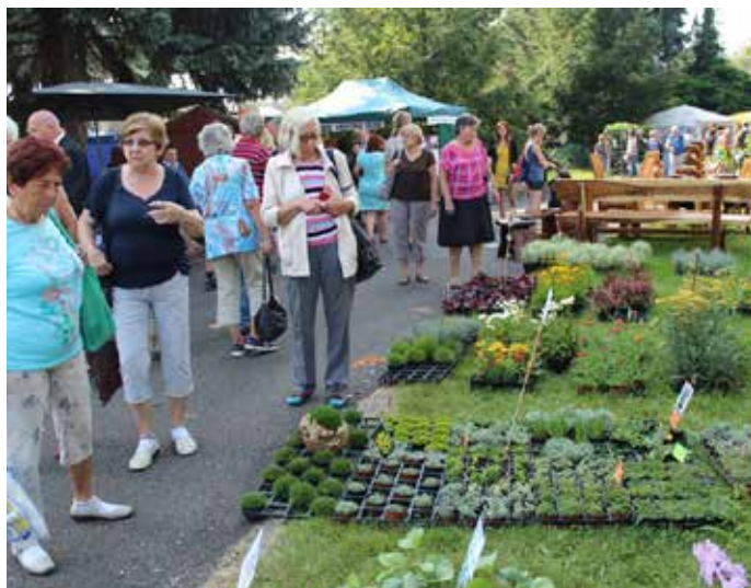
JAKO TRADIČNĚ BYL PRO NÁVŠTĚVNÍKY NA ZAHRADĚ ČECH připraven široký sortiment sazenic, keřů, rostlin a dalších květin nejen na zahradu.

Certifikáty vítězům předala náměstkyňe ministryně zemědělství Viera Šedivá, hejtmán Ústeckého kraje Oldřich Bubeníček se svým prvním náměstkem Stanislavem Rybákem, litoměřický starosta Ladislav Chlupáč