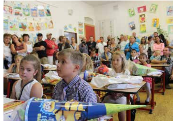
PRVNÍ ŠKOLNÍ DEN – očekávání a nervozita.

ve spolupráci s policií a obcemi vytipováno 11 nejfrekventovanějších přechodů pro chodce napříč celým krajem, na které se dopravní policie ve spolupráci s Besipem a krajským úřadem zaměří.