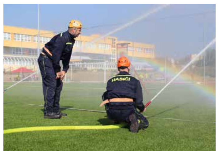
V MOSTĚ VE VELEBUDICÍCH se uskutečnil další ročník finále hasičských soutěží Stimax Cup a Tohatsu Fire Cup (viz foto).