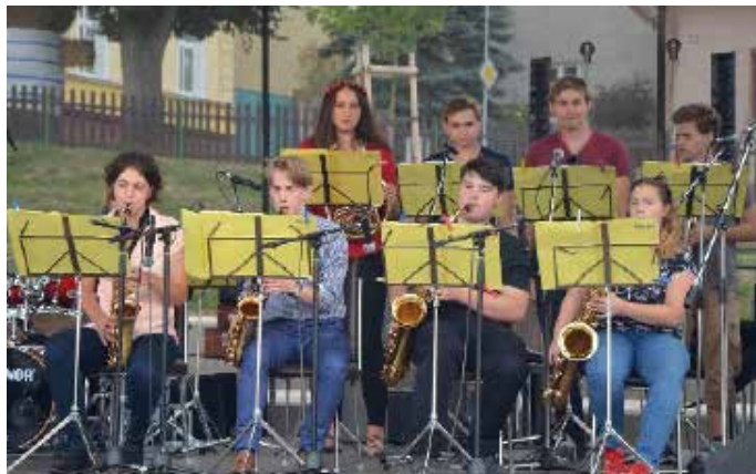
MLADÍ MUZIKANTI si dali dostaveníčko v Kostomlatech pod Milešovkou.

Dále pak popřál festivalu hodně zdaru nejen při jeho pre-