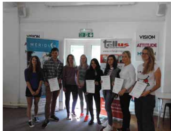
NA KONCI dostali žáci certifikáty.

Připravili: žáci studijních oborů ZL 3, ZA a DVS