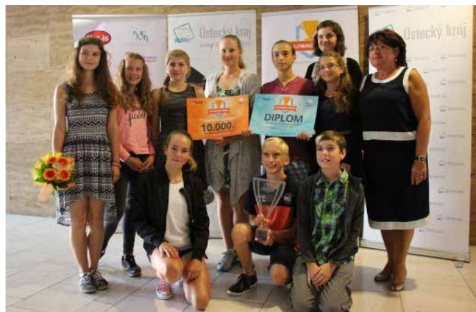
Žáci GYMNAZIA A STŘEDNÍ ODBORNÉ ŠKOLY, Klášterec nad Ohří s náměstkyní hejtmana Janou Vaňhovou (vpravo).

„V Ústeckém kraji má sport velmi dobrou pozici ve všech svých odvětvích i věkových kategoriích. Do sportování se zapojují již mateřské školky v projektu Děti na startu, v rámci starších dětí máme projekt Atletika pro děti, výraznou podporu kraje věnujeme Labe areně v Račicích, kde vzniká národní olympijské centrum vodních sportů,“ vyjmenovala při svém úvodním projevu Jana Vaňhová jen část sportovních aktivit v regionu, které probíhají s finanční podporou Ústeckého kraje.