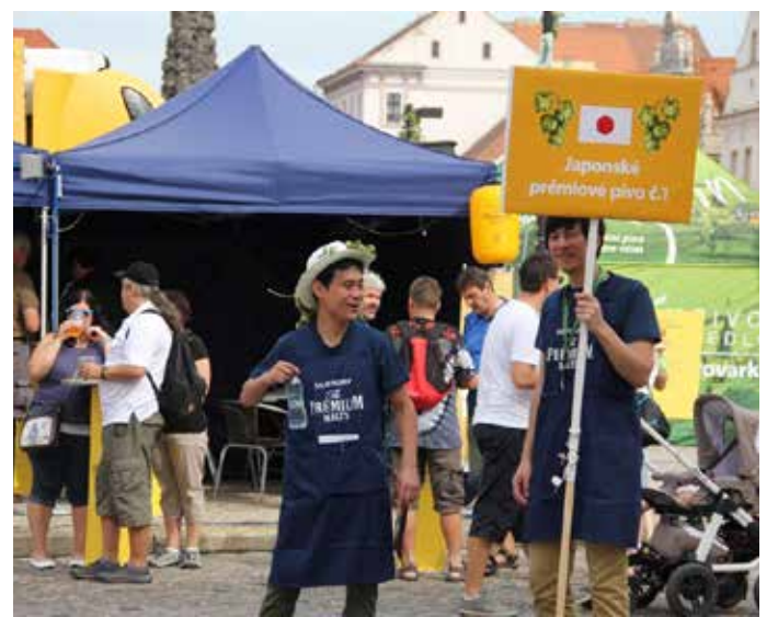
JAPONŠTÍ ZÁSTUPCI PIVOVARU lákali návštěvníky na zlatavý mok.

V rámci Žateckých slavností chmele zaplnili město po oba dny desetitisíce návštěvníků z tuzemska i ze zahraničí, kteří se mohli pobavit na třech programových scénách i historickém tržišti, zájemce přivítaly také muzea, Chrám chmele a piva i Chmelový maják. Nechyběla ani řada doprovodných akcí, jejichž hlavním jmenovatelem nebylo nic jiného než pivo.