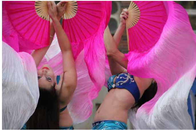
STUDIO KARIMA vystoupilo na Barevné planetě s orientálními tanci.

V rámci spolupráce kraje se srbským regionem Jižní Banát se na letošním multietnickém festivalu prezentovaly tradiční národní pokrmy právě z této části Balkánu. K ochutnání byl typický balkánský kajmak, ajvar, proja nebo baklava. Krajské město navštívila i samotná srbská delegace.