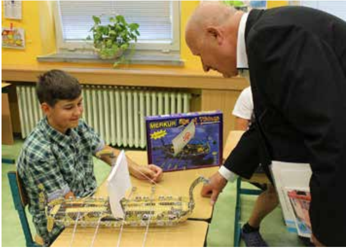
HEJTMÁN ÚSTECKÉHO KRAJE Oldřich Bubeníček obdivuje výtvarny z stavebnice.

Zastupitelstvo Ústeckého kraje na svém červnovém zasedání schválilo dotaci mosteckým školám na projekt Podpora technického vzdělávání žáků základních škol. Jedná se o dotaci z darů od Vršanské uhelné, a. s., která souhlasila s vyčleněním 3 milionů korun na projekt.