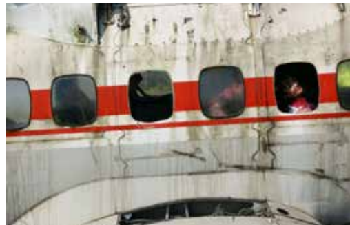
PŘI CVIČENÍ tuha krev v žilách.

Komentovaný začátek a průběh cvičení v místě zásahu uváděl, že výpadek motorů postihl letadlo se sedmdesáti pasažéry při letu z Prahy do Drážďan. Pilot se podle scénáře cvičení pokusil o nou-