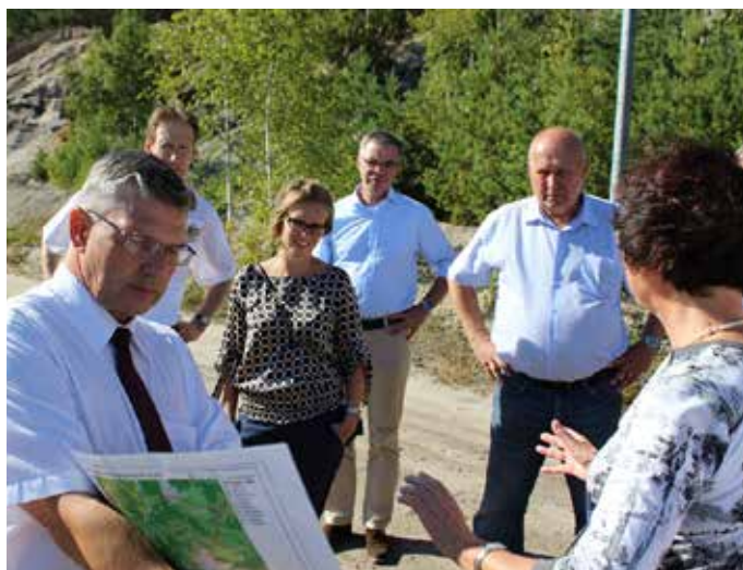
ZÁSTUPCE SPOLEČNOSTI Lužická a středoněmecká hornicko-správní seznamuje delegaci z Ústeckého kraje s plánovanými záměry.

hnědého uhlí. Diskutovalo se o záměru Evropského napojení na vedení plynu, obchvatu Pirny, záměru výstavby mezinárodní železniční tratě Rumburk-Sei-