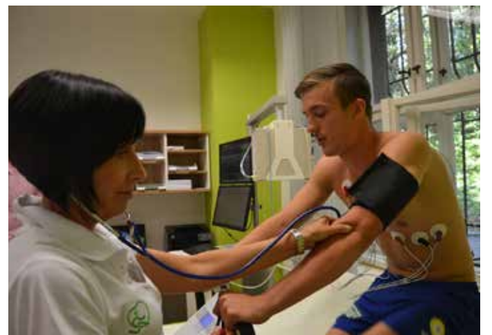
SPORTOVČŮM se v novém oddělení dostane kvalitní péče.