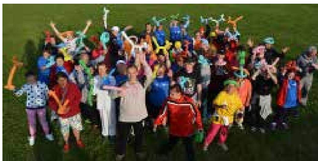
O KLIENTY CENTRA je dobře postaráno.

postižení. Děti tak mají možnost vyrůstat v samostatných domácnostech připomínajících po všech stránkách běžné rodinné prostředí a jejich život se tak mnohem více podobá chodu a modelu klasické rodiny. Ve spolupráci s předškolními a školními zařízeními Lovosic a Litoměřic se Centrum snaží integrovat děti z těchto bytů do kolektivu jejich vrstevníků v rámci mateřských škol a navazujících školních zařízení.