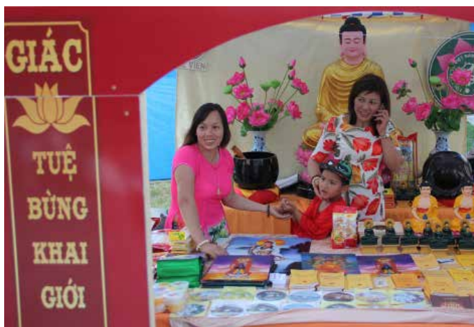
VIETNAMSKÁ KOMUNITA je v Česku početná, jejich stánek navštívilo mnoho lidí.

Mezi účinkujícími kapelami vystoupila i multikulturní seskupení jako například latinoameričtí Mr. Loco, španělská Sista Carmen, srbská partička Eric and the worldly savages, afričtí Njachas či čeští Electro swing allstars.