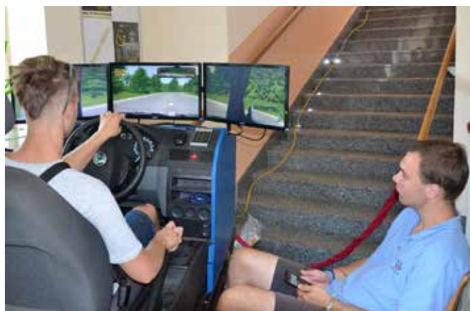
HLAVNĚ KLUCI využili simulátor jízdy.

stav po požití alkoholu a drog, přehlídka vybavení speciální pořádkové jednotky Policie ČR, poskytování první pomoci. Soutěžilo se v parkování na přesnost, z níž bude vybrán za každý den jeden chlapec a jedna dívka, kteří měli nejmenší součet centimetrů. Předání cen bude probíhat v měsíci říjnu v dané škole, odkud student pochází a předá je radní pro dopravu Ústeckého kraje.